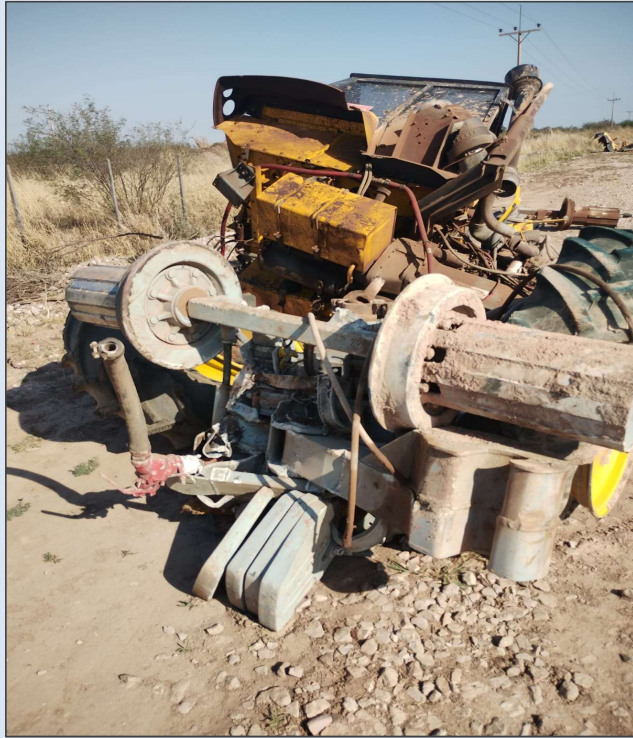
Figura 1. Restos de la maquinaria de vía afectada por el choque.