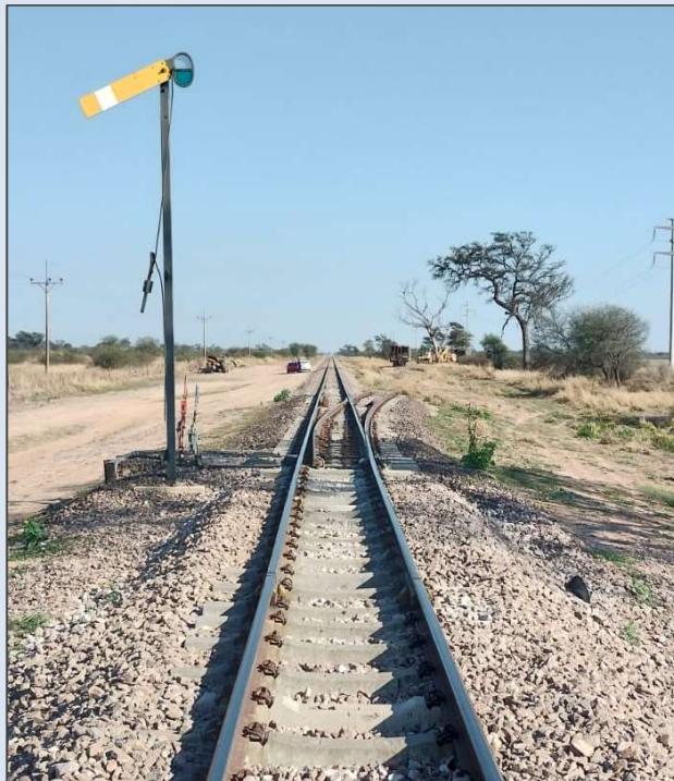
Figura 2. Imagen del desvío particular, donde se observa el indicador de posición del aparato de vía (ADV) de ingreso al mismo.