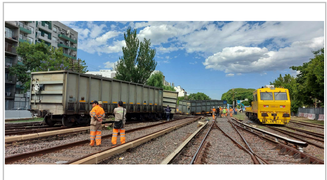
Fig. 2. Vista de los vagones interrumpiendo la vía principal, JST