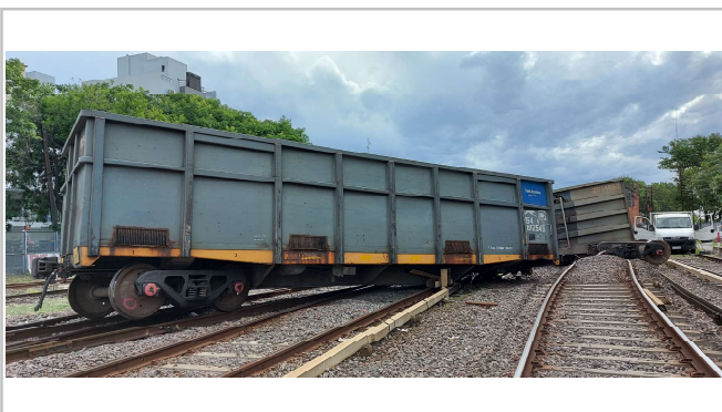
Fig. 3. Vista del vagón que inició el descarrilamiento, JST