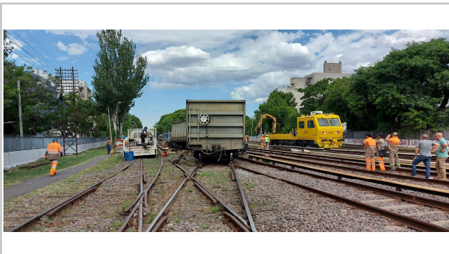
Fig. 1. Vista desde la vía de cruce, JST