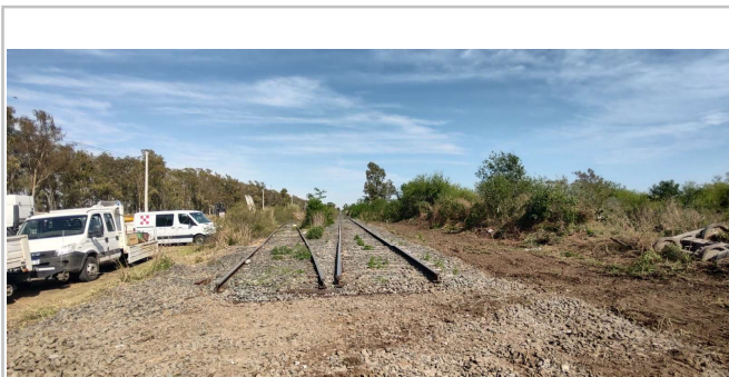
Fig 3. Imagen de la zona del inicio del descarrilamiento, JST