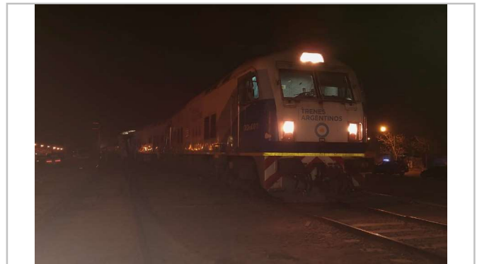
Fig 2. Imagen de la locomotora titular