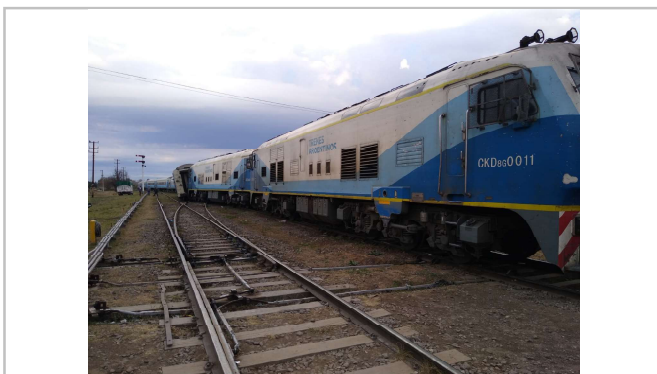
Fig 3. Imagen del tren N° 267 y del aparato de vía