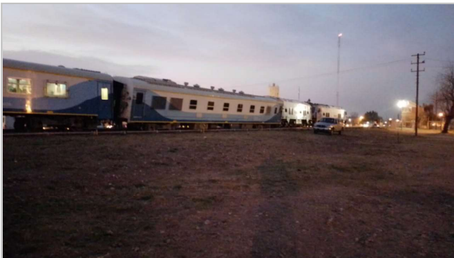
Fig 1. Imagen del coche descarrilado