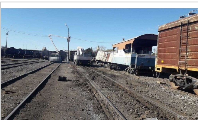
Fig. 3. Lugar del choque y marcas previas de descarrilamiento