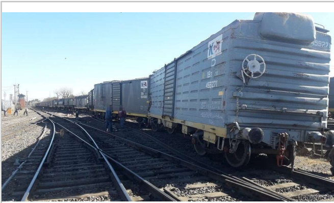
Fig. 1. Parte de la formación en la playa antes de ser encarrilada