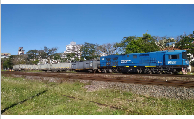
Figura 1. Vista norte del descarrilamiento.