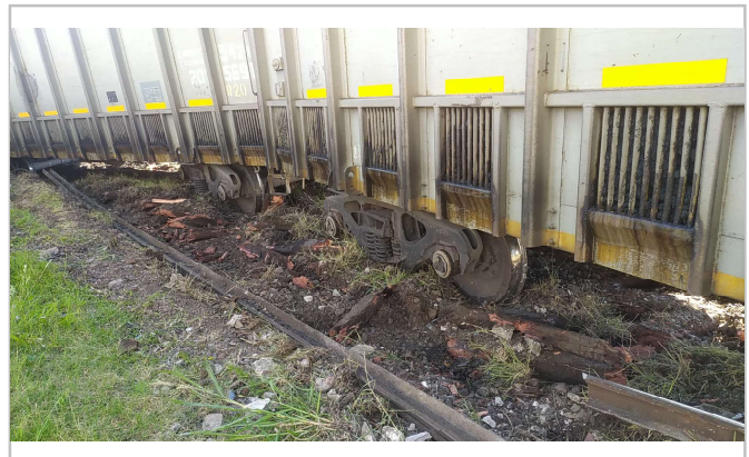
Figura 2. Daños en superestructura, lado sur.