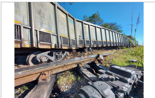
Figura 3. Daños a la altura del cambio 50.