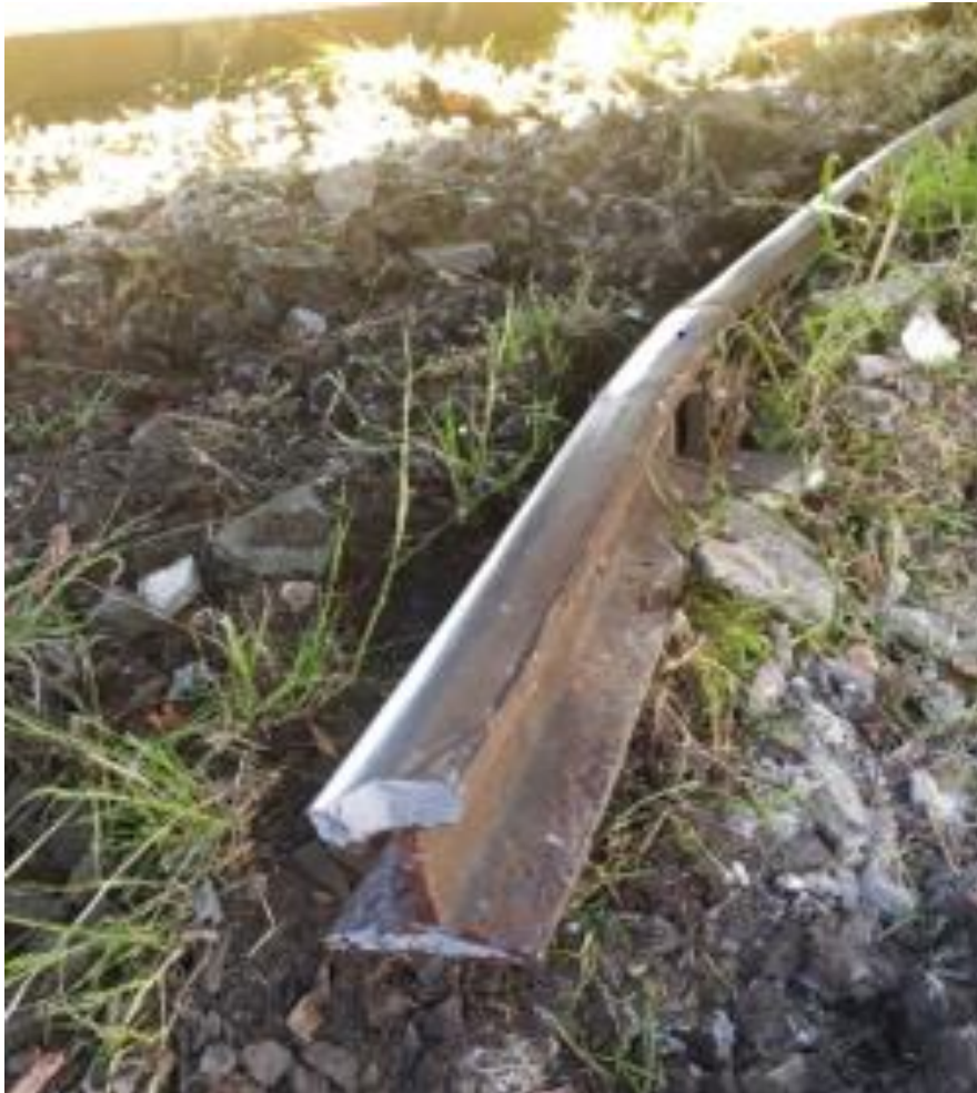
Figura 4. Riel partido.