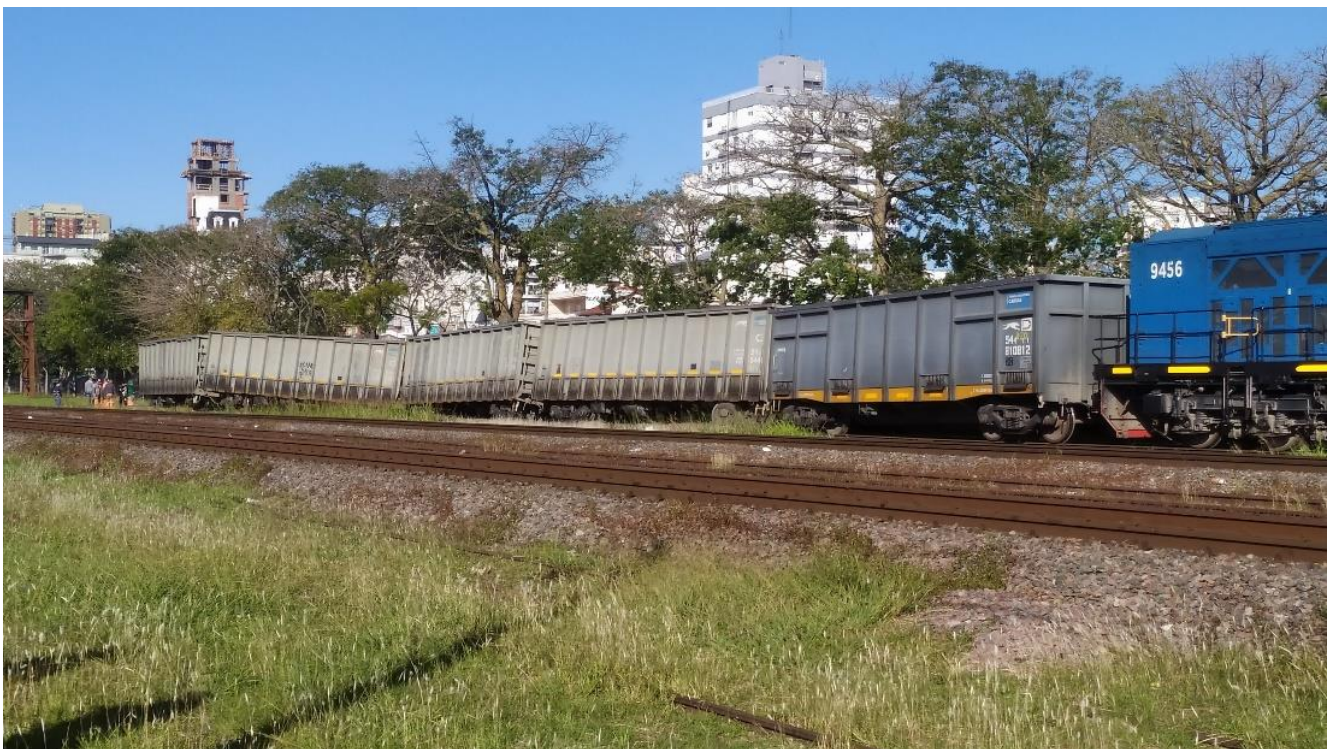
Figura 1. Vista general del tren C52/2271 involucrado en el accidente.

La vía por la que circulaba el tren C52/2271 al momento del accidente es operada por la empresa SOFSE, y el ramal al que estaba por ingresar para continuar su recorrido hacia la terminal Dock Central, es operado por la empresa BCyL.