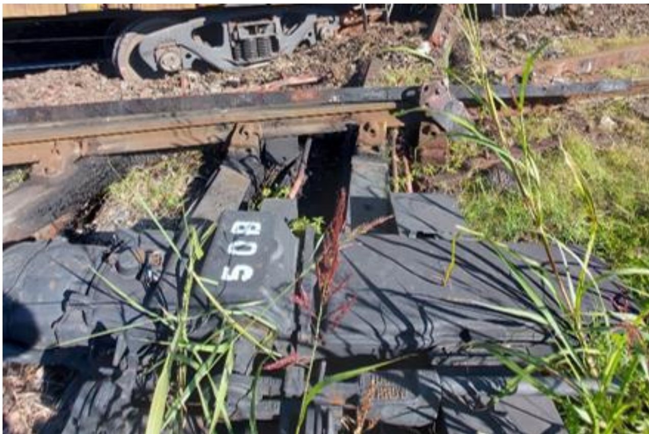
Figura 2. Máquina de cambio del ADV 50 B.