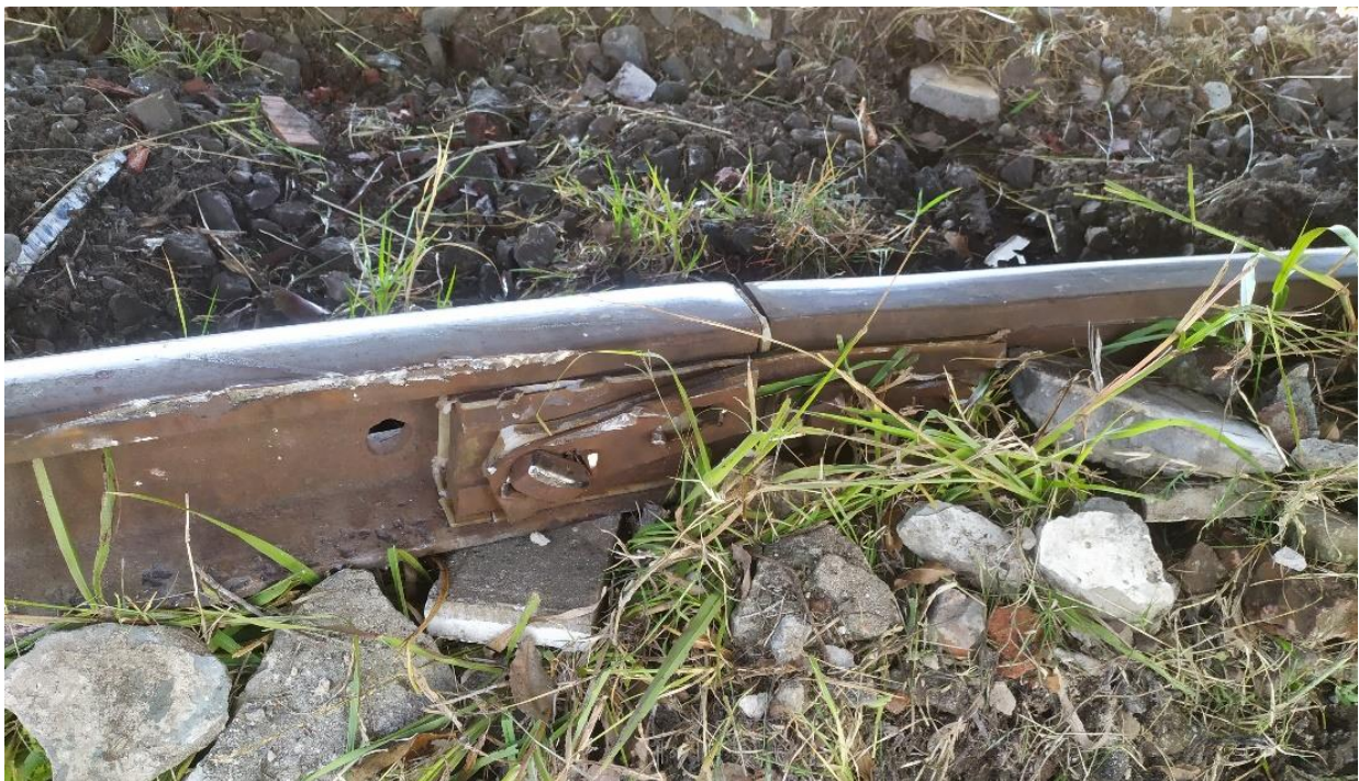
Figura 3. Daños en la junta aislada para señalamiento.

Los accionamientos de la máquina de cambio 50 B sufrieron daños producto del descarrilamiento. También se registraron daños en los rieles y en las juntas aisladas para el sistema de señalamiento que forman parte de la superestructura de vía.