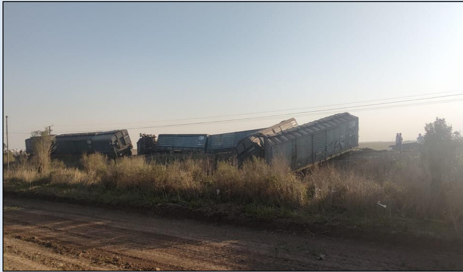
Figura 1. Vista general del descarrilamiento.