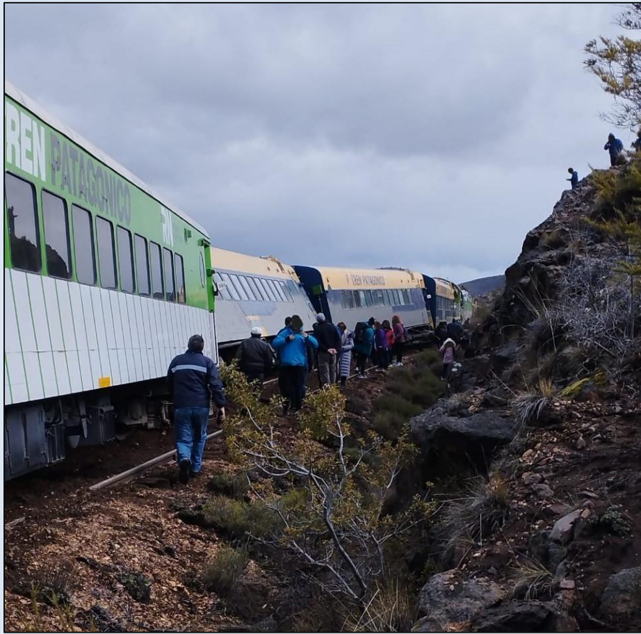
Figura 1. Imagen del tren 363 descarrilado. Fuente: JST, 2023