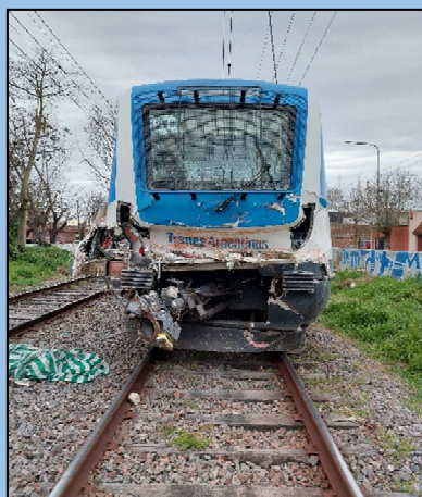
Figura 2. Daños estructurales sobre cabina de conducción.