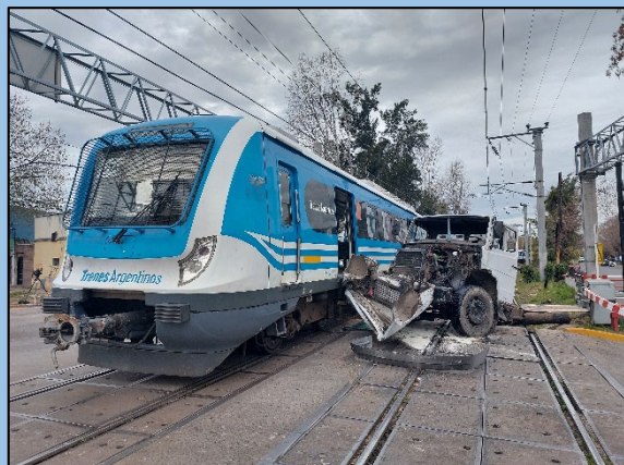
Figura 1. Posición final de los vehículos tras la colisión.