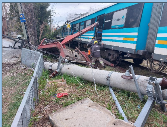
Figura 3. Daños sobre la infraestructura ferroviaria.