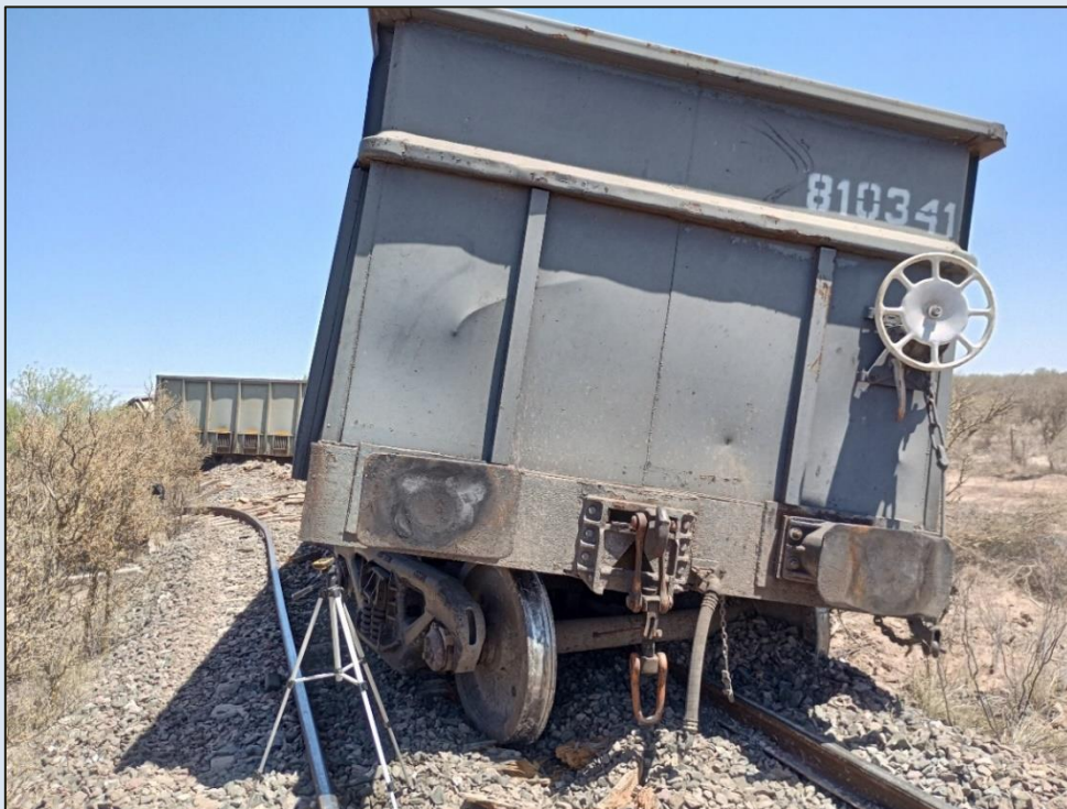
Figura 2. Vagones descarrilados y deformación de rieles.