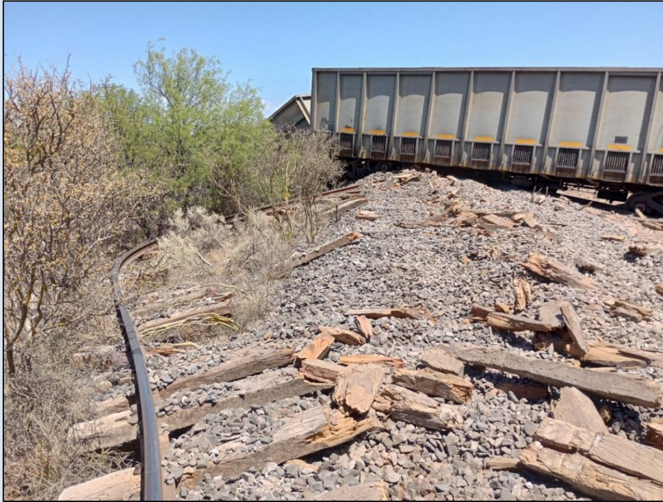
Figura 1. Deformación y rotura de rieles y de durmientes en la zona del suceso.