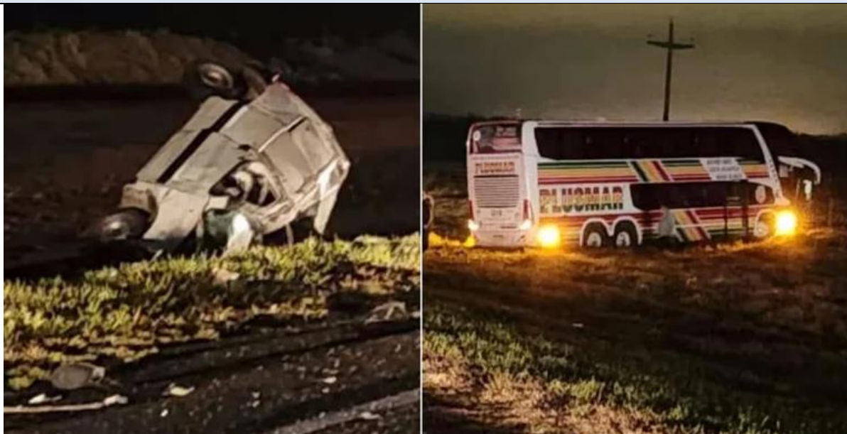
Figura 1. Posiciones finales de los vehículos.