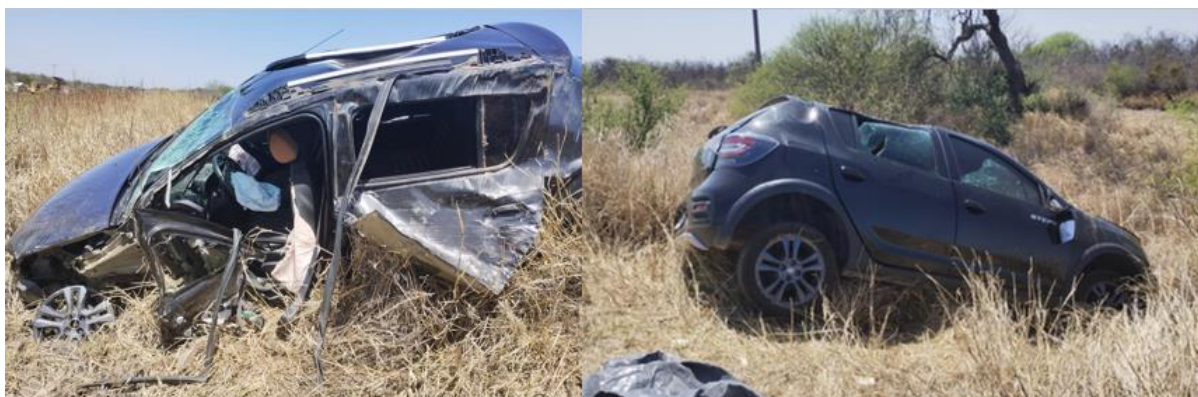
Figura 11. Daños sobre el automóvil particular (Vehículo 2) en su posición final.

Sobre el Vehículo 2, se relevó deformación y rotura del techo, puertas izquierdas laterales, guardabarros izquierdo delantero, neumático izquierdo delantero, parabrisas, espejos retrovisores de ambos lados y faros delanteros, coincidentes con el impacto con el Vehículo 1 y posterior vuelco.