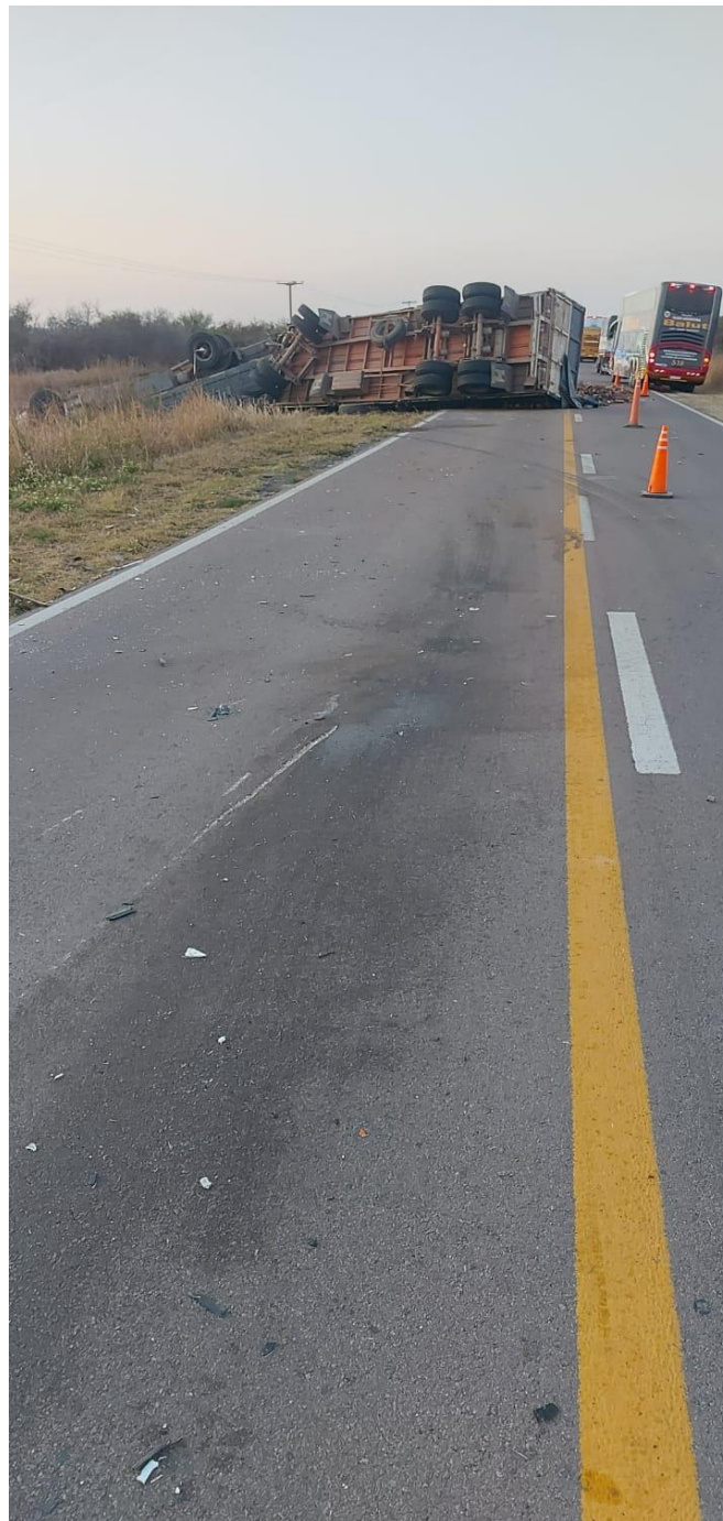
Figura 15. Efracciones producidas por el Vehículo 2 poscolisión e improntas neumáticas correspondientes al Vehículo 1 hasta su posición final.