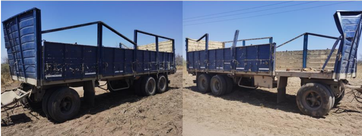
Figura 9. Visualización de los daños constatados sobre el acoplado del Vehículo 1 poscolisión.