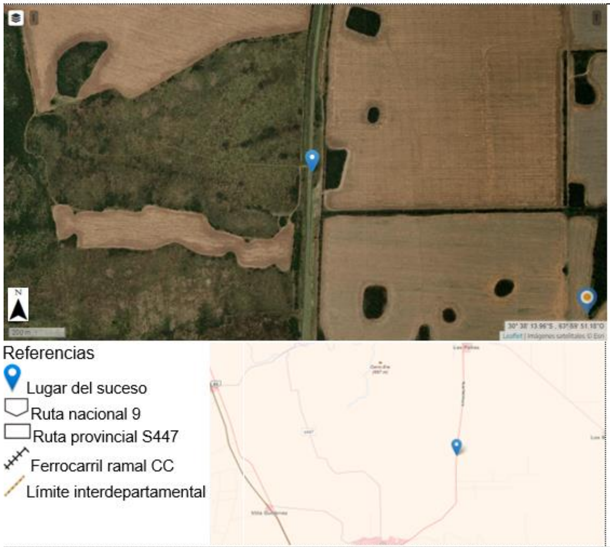
Figura 2. Mapa de localización del suceso.