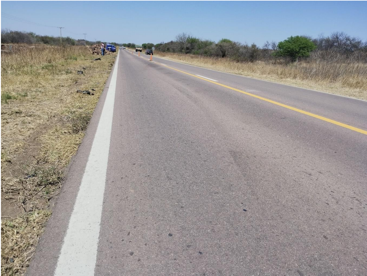
Figura 16. Huella de derrape sobre el carril que se dirige hacia Las Peñas correspondiente con la trayectoria poscolisión del Vehículo 2.