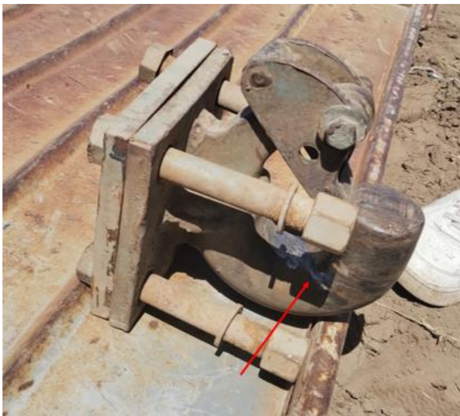
Figura 10. Enganche N.º3 para acoplado retirado y paquete de elásticos gastados. Fuente: JST, 2023