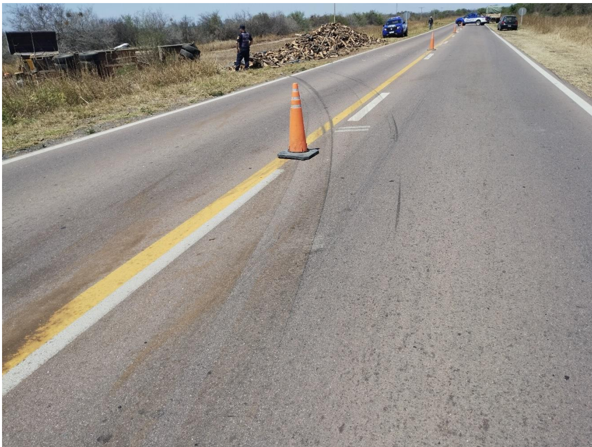
Figura 13. Fotografía de las huellas de derrape, de 21 metros de longitud, tomadas desde el carril que se dirige hacia Villa del Totoral.