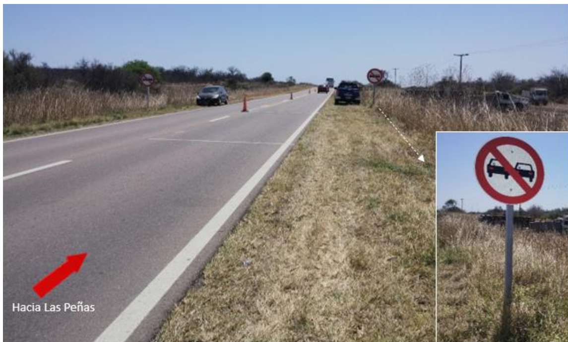
Figura 3. Señalización horizontal sobre la calzada y cartel de prohibición de adelantamiento para vehículos que circulan hacia Las Peñas.