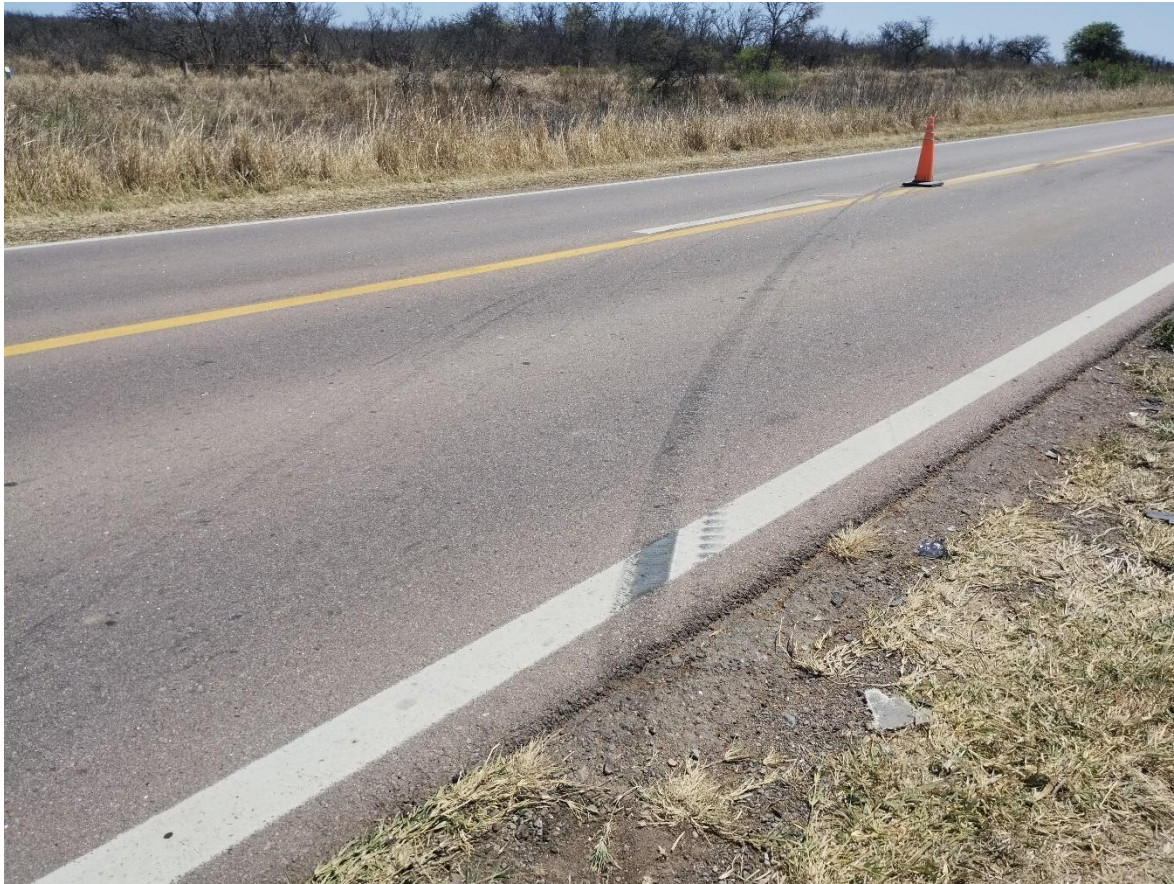
Figura 14. Fotografía de las huellas de derrape tomada desde el carril que se dirige hacia Las Peñas.