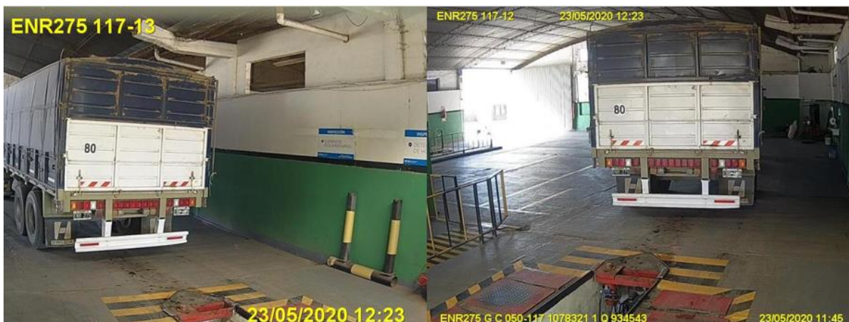
Figura 5. Fotovalidación de la cabina del Vehículo 1 al momento de la última revisión en 2020 y detalle de anomalías detectadas.