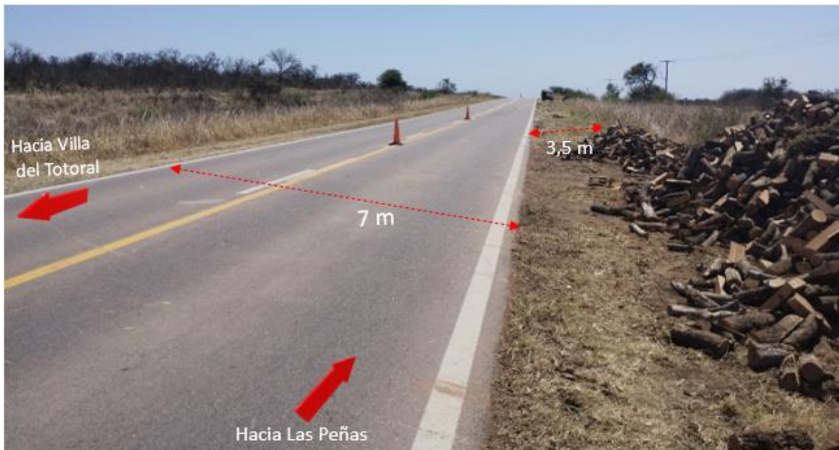
Figura 2. Medidas y características de la vía.