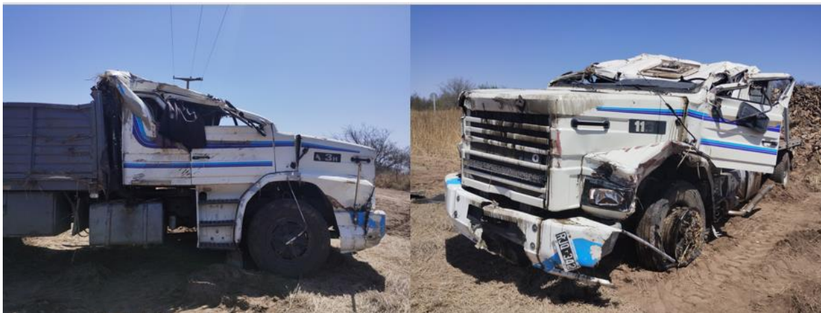
Figura 7. Visualización de los daños constatados sobre la cabina del Vehículo 1 poscolisión.

Por otro lado, sobre el acoplado se relevó deformación de su estructura con fuerzas actuantes de adelante hacia atrás.