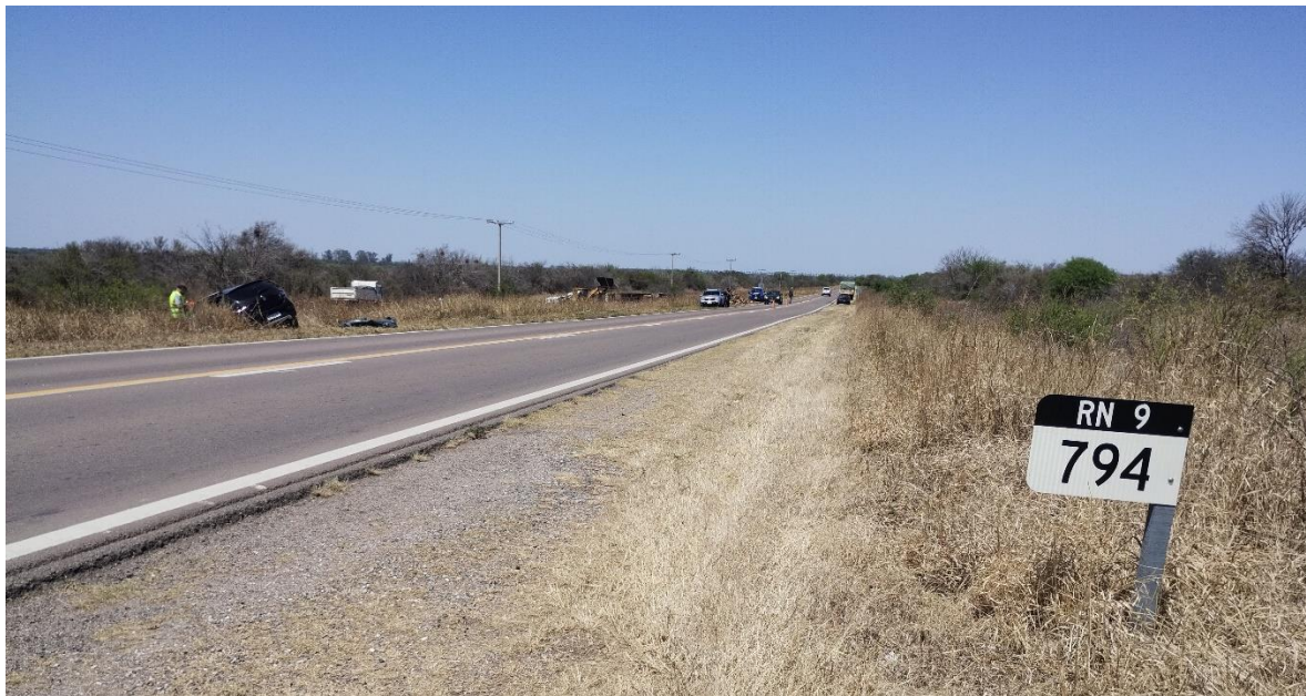
Figura 4. Mojón kilométrico junto al sentido de circulación hacia la localidad de Villa del Totoral.