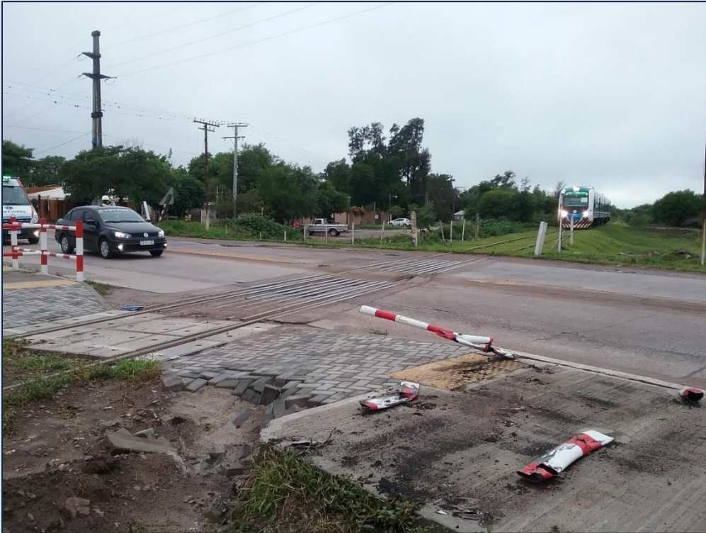
Figura 3. Paso a nivel de la Ruta Provincial 51.