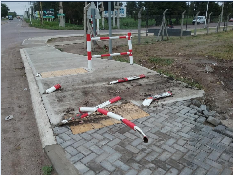
Figura 2. Rotura de laberinto peatonal.