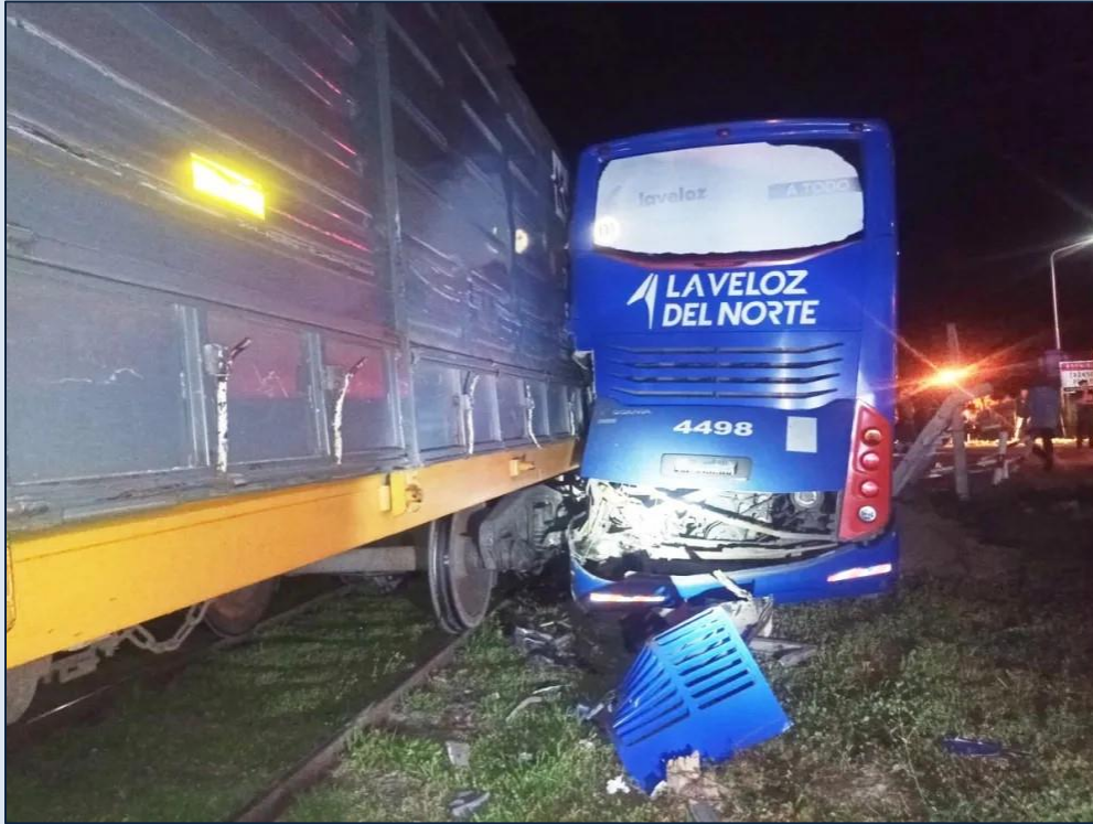
Figura 1. Tren y ómnibus involucrados en el suceso. Fuente: Nuevo Diario , 2023