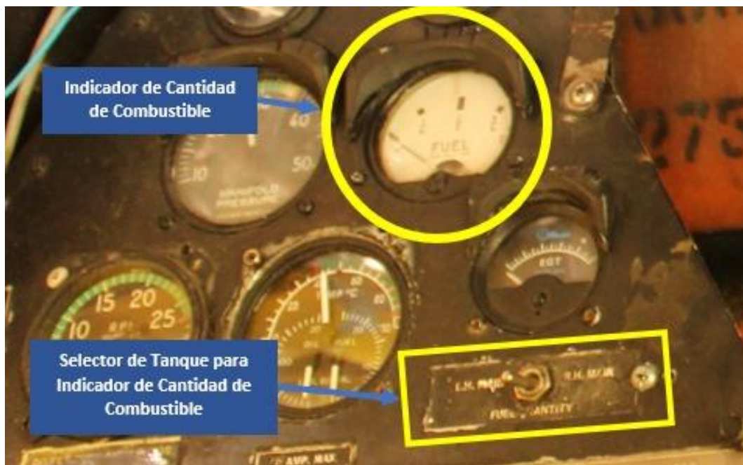
Figura 4. Imagen del indicador de combustible en la cabina de vuelo.

La aeronave estaba equipada con dos tanques de combustible, ubicados en cada semi-ala, con una capacidad de 200,6 litros cada uno, de los cuales 3,8 litros no eran utilizables. Asimismo, contaba con un indicador de cantidad de combustible incorporado en el tablero de vuelo, fácilmente visible. No obstante, es relevante destacar que este tipo de indicador no proporciona una lectura precisa de la cantidad de combustible remanente.