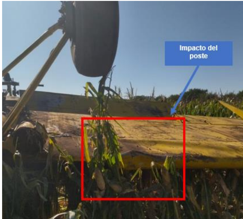
Figura 7. Abolladura sobre borde de ataque.

Se observó una abolladura en el borde de ataque de la semi-ala derecha, la cual coincidía con la posición del poste del alambrado.