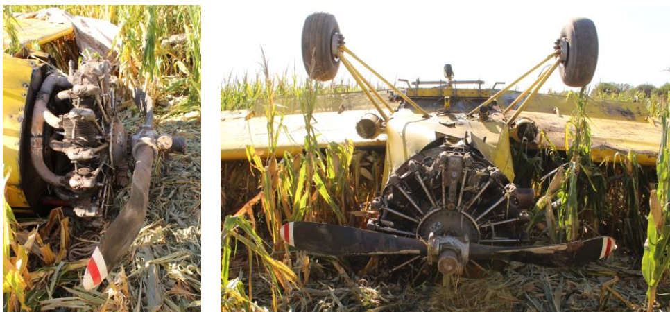
Figura 8. Deformación de la hélice.

Además, se identificó una ligera deformación hacia atrás en las palas de la hélice, en sentido del desplazamiento de la aeronave sobre el terreno.