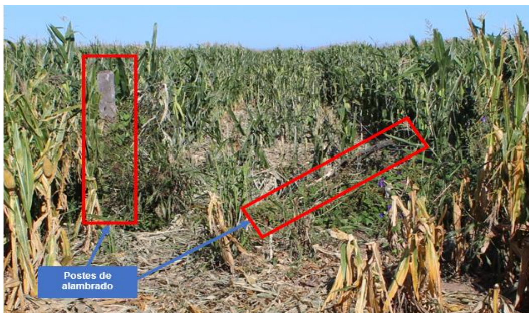
Figura 6. Posición de los postes del alambrado.