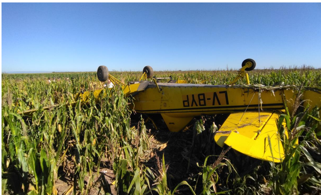
Figura 1. Posición final de la aeronave LV-BYP.

Como consecuencia del suceso, la aeronave experimentó daños de importancia en la parte superior de la cabina, hélice, ala y empenaje.