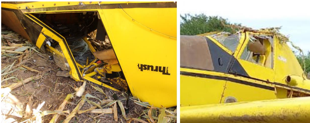
Figura 3. Daños en la cabina.

La aeronave estaba equipada con dos tanques de combustible, ubicados en cada semi-ala, con una capacidad de 200,6 litros cada uno, de los cuales 3,8 litros no eran utilizables. Asimismo, contaba con un indicador de cantidad de combustible incorporado en el tablero de vuelo, fácilmente visible. No obstante, es relevante destacar que este tipo de indicador no proporciona una lectura precisa de la cantidad de combustible remanente.