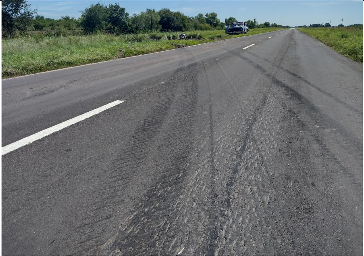
Figura 2. Marcas de derrape producidas por el Vehículo 1 con dirección hacia el lado opuesto al de su carril de marcha.