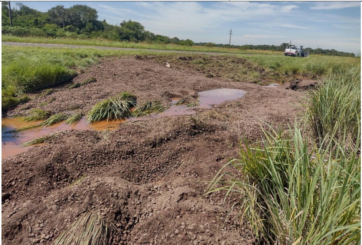
Figura 3. Lugar donde se produjo el despiste y vuelco del Vehículo 1.