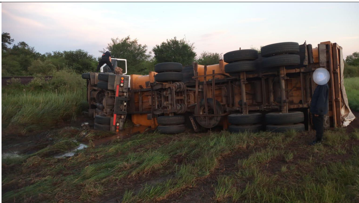
Figura 4. Posición final del Vehículo 1.