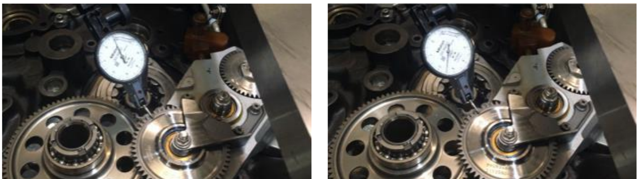
Figura 4. Comprobación de giro en el plano de los engranajes del sensor de torque

La aeronave ya había tenido un accidente en condiciones similares con pérdida de potencia durante un vuelo de aeroplación en 2013 (Expediente JIAAC N°339/13). De acuerdo con la información disponible, también se encontró en dicho suceso la rotura del engranaje del sensor de torque. Sin embargo, no fue posible obtener información acerca de la reparación realizada dado que el TAR interviniente no poseía la correspondiente orden de trabajo al haber expirado el tiempo de guarda del mencionado documento (5 años).