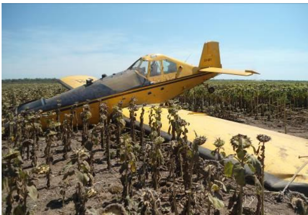
Figura 1. Aeronave involucrada en el accidente

El accidente ocurrió de día y en buenas condiciones meteorológicas.