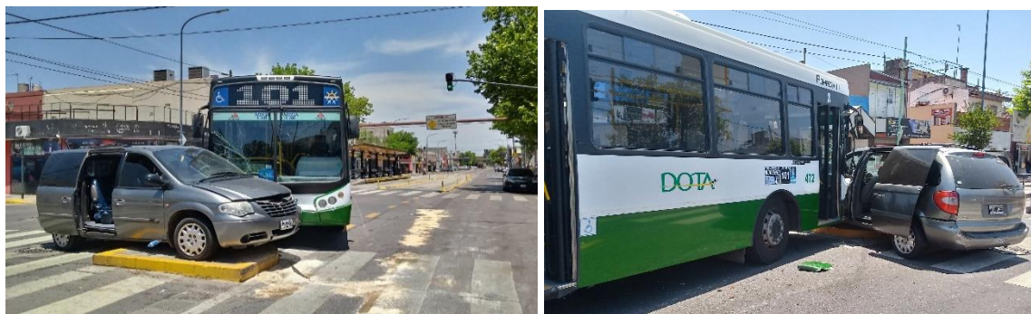
Figura 2. Posiciones finales de los vehículos.