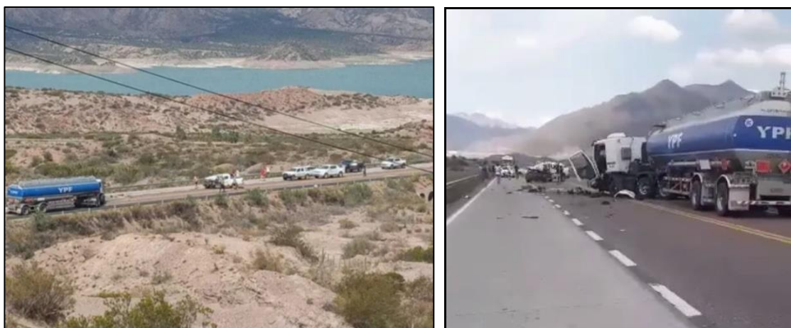
Figura 1. Posición final de los vehículos involucrados donde se pueden observar los daños en la unidad tractora del Vehículo 1.