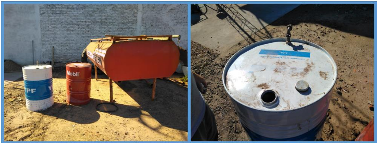
Figura 7. Combustible almacenado en la base de operaciones

El combustible utilizado por la aeronave era almacenado en un barril metálico de 205 litros ubicado en la plataforma de la base de operaciones. Su etiqueta identificatoria describía al contenido como aceite lubricante.