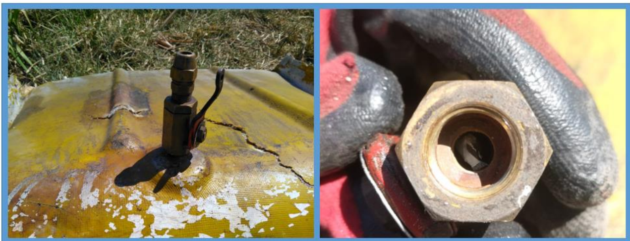
Figura 4. Válvula del tanque suplementario y restos de material encontrados

Los tanques de combustible principales, ubicados en ambos planos, se encontraban desconectados del sistema de combustible. El tanque de combustible suplementario, instalado en la nariz de la aeronave, era el único utilizado para la operación. En la inspección visual realizada a la válvula de conexión al circuito de combustible se detectaron restos de un material de tipo polimérico.