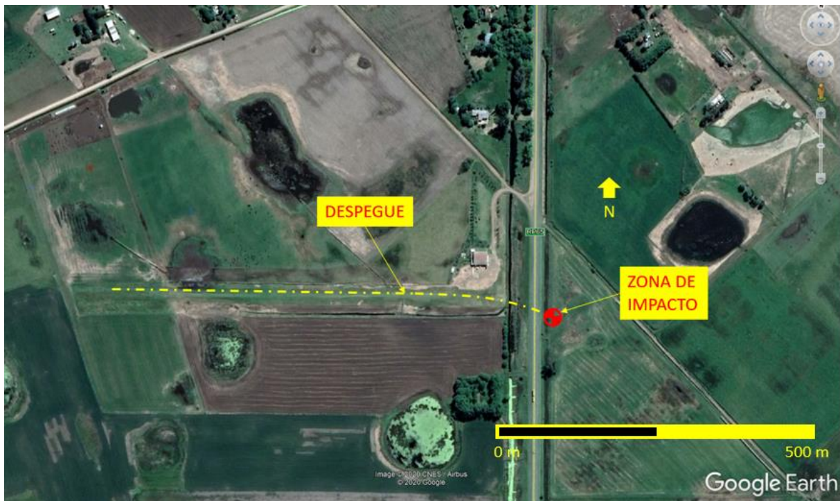
Figura 2. Trayectoria aproximada de la aeronave

Las marcas identificadas en la ruta provincial 65 sugieren que se produjo un impacto inicial de la aeronave con la rueda de cola. Posteriormente, la aeronave continuó su recorrido hasta que el tren de aterrizaje principal izquierdo impactó contra el terreno lindero a la ruta, ocasionando que ésta rotara en sentido antihorario, aproximadamente 180°. La aeronave se detuvo con rumbo 295° y no hubo dispersión de restos.