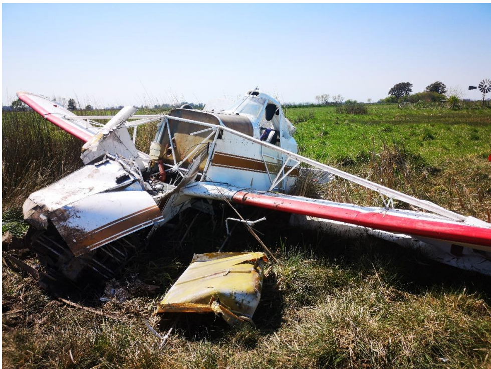
Figura 1. Aeronave involucrada en el accidente

El accidente ocurrió de día y en condiciones de buena visibilidad.