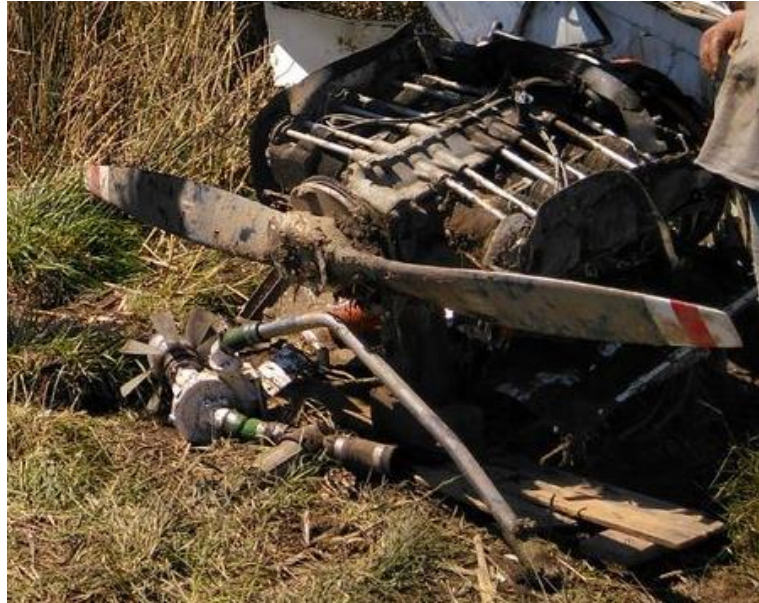
Figura 3. Deformación de la hélice

De acuerdo con el ensayo realizado en el Laboratorio de Ensayo de Material (LEM) de El Palomar, la muestra de aceite extraída del purgante del cárter resultó no apta para su utilización dada su elevada viscosidad.