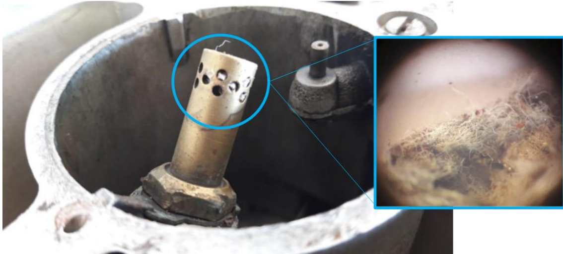
Figura 5. Obstrucción detectada en el surtidor del carburador

El carburador fue analizado en el laboratorio de la JST donde se identificó una obstrucción en el surtidor de combustible. De acuerdo con la inspección realizada, esta obstrucción era ocasionada por un material fibroso, también de tipo polimérico.