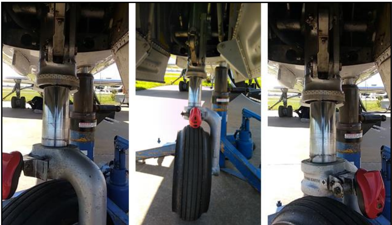
Figura 5. Prueba realizada en taller donde se observa la rueda a su máximo recorrido hacia ambos lados