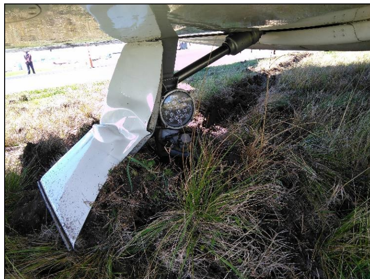
Figura 3. Puerta del tren de aterrizaje principal derecho

Como resultado de la excursión de pista, la aeronave experimentó daños leves. Se observaron deformaciones en la tapa externa del tren de aterrizaje principal derecho.