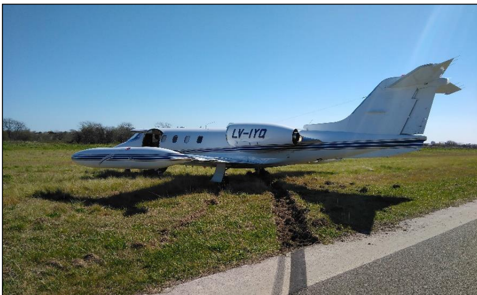
Figura 1. Posición final de la aeronave

El suceso ocurrió de día y en buenas condiciones meteorológicas.