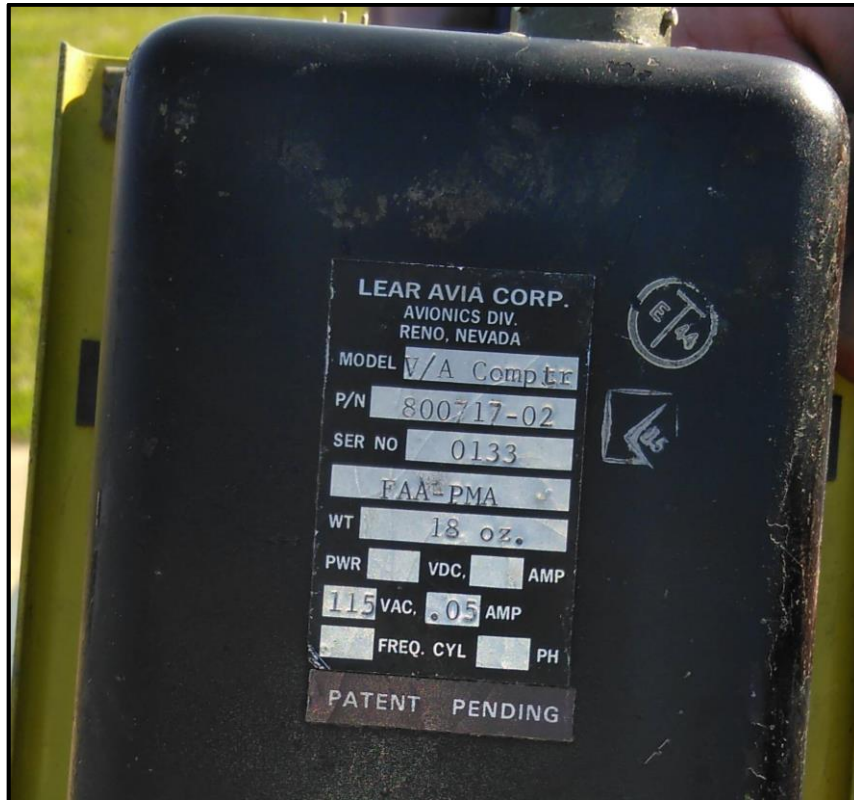
Figura 4. Computadora de control de steering