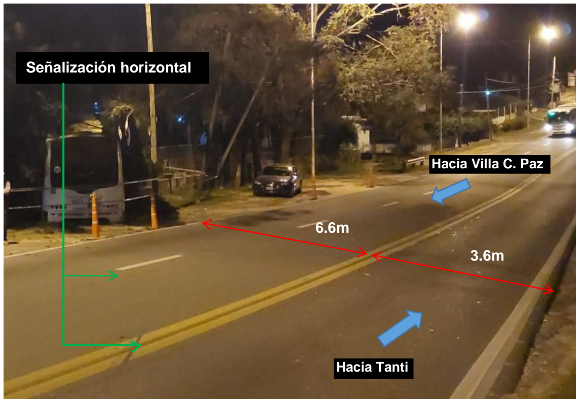
Figura 3. Características de la vía de circulación en el lugar del suceso.