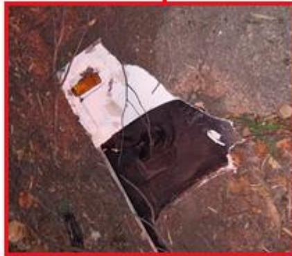
Figura 4. Daños en el sector anterior del vehículo (paragolpes, ópticas, radiador y parabrisas).