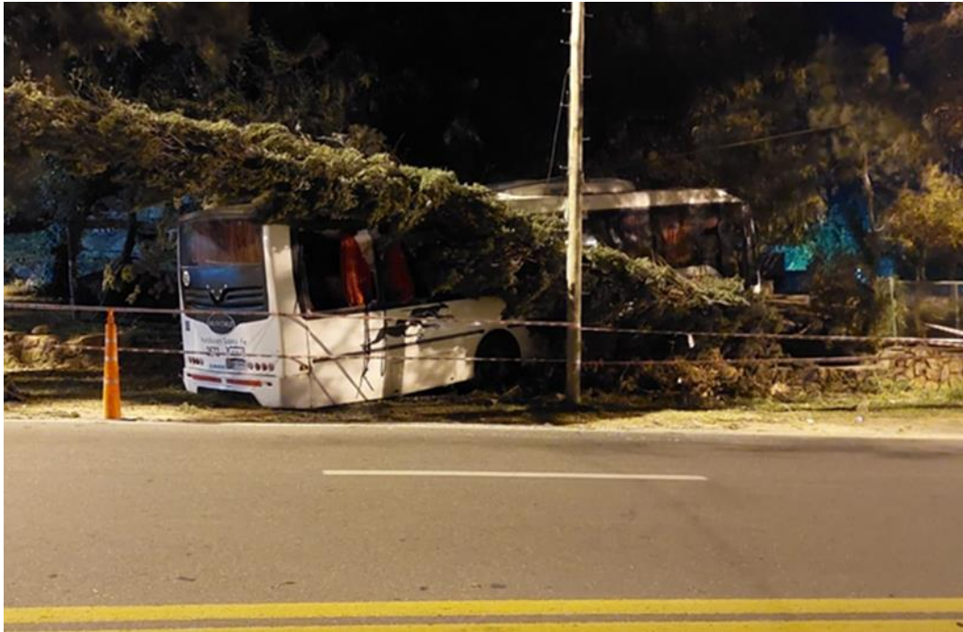
Figura 1. Posición final del vehículo tras el choque.

resultado del suceso, se registraron daños materiales en la unidad, en la propiedad impactada y lesiones en 21 pasajeros y en el conductor, los cuales fueron trasladados al hospital municipal Dr. Gumersindo Sayago.