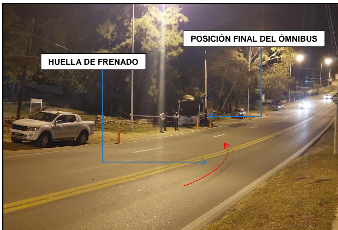
Figura 7. Indicios de interés accidentalológico y posición final del ómnibus.

Posteriormente a la maniobra realizada, el vehículo continuó con su marcha en la misma dirección, atravesó la calzada y la banquina oeste y posteriormente impactó contra un árbol y la estructura de la edificación lindante a la vía de circulación. Finalmente, el rodado quedó detenido sobre la banquina con sentido hacia Villa Carlos Paz y empotrado sobre la edificación lindante a la vía de circulación en forma transversal y oblicua, con su parte anterior hacia el cardinal noroeste y su parte posterior hacia el cardinal sureste (ver Figura 7).