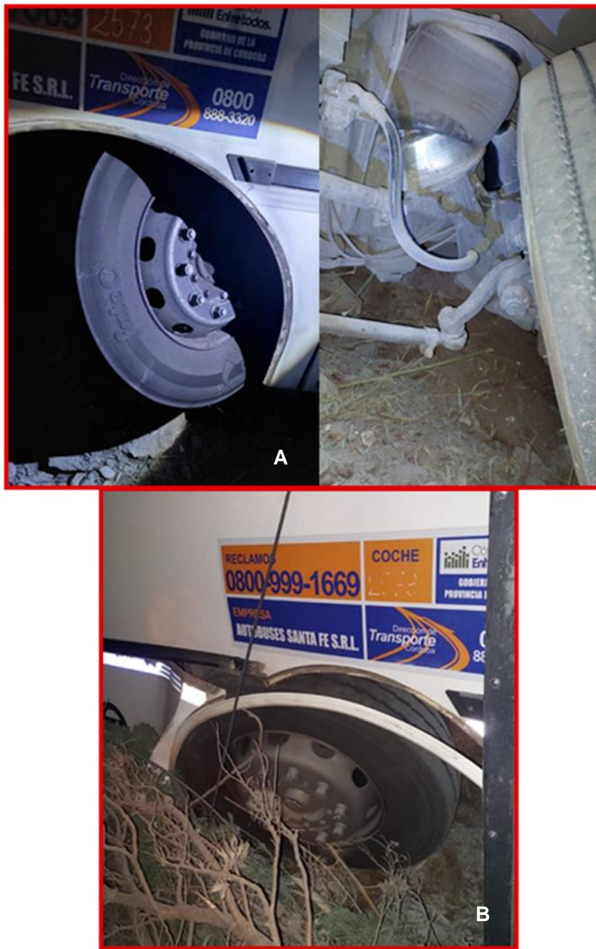
Figura 5. Daños en el eje delantero (desalineación de ruedas delanteras).