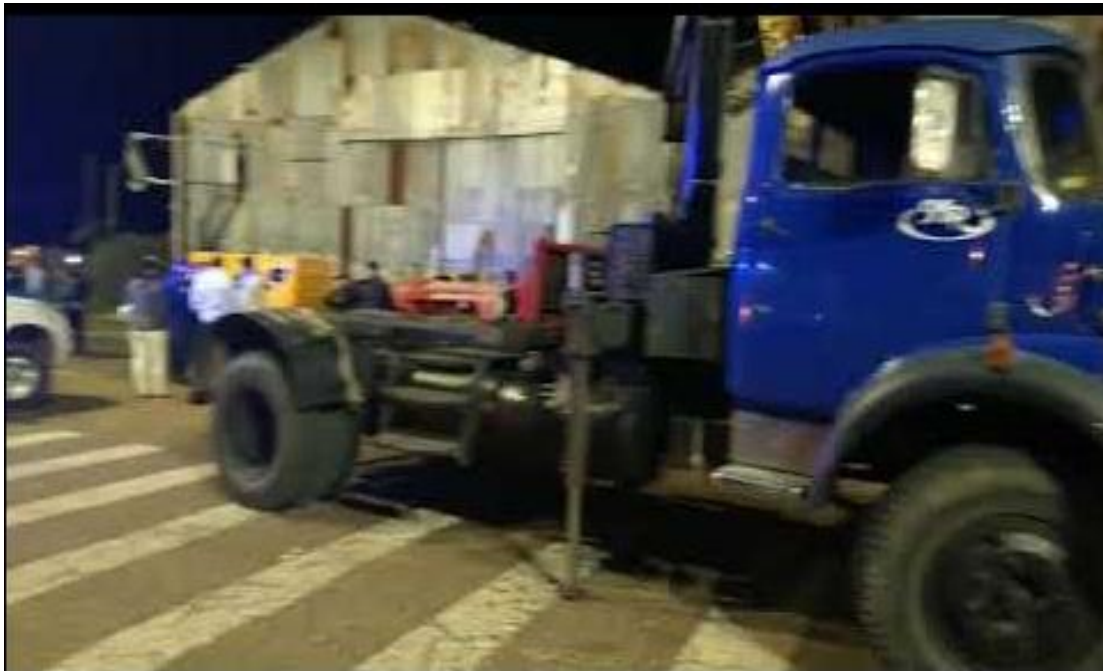
Figura 2. Camión dominio VGY623, luego del desprendimiento de la guindola.

Ni el camión ni el brazo hidráulico presentaron daños estructurales.