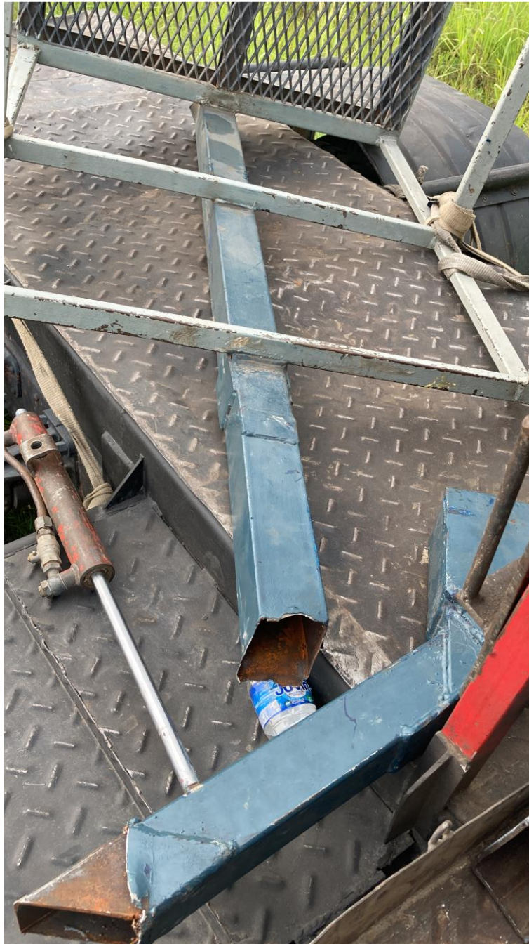
Figura 4. Imagen del mástil de la guindola.