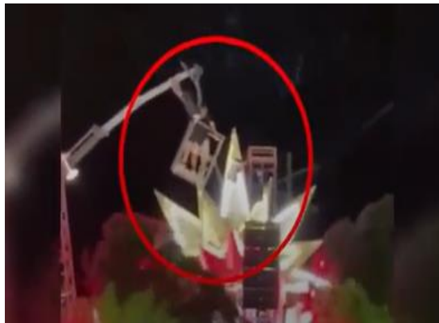
Figura 11. Secuencia del desprendimiento de la guindola (editado por la fuente periodística).

Cabe destacar que este trabajo de preparación de las carrozas se realizaba, habitualmente, entre las 16:00 y las 18:00. Debido a que las condiciones meteorológicas no fueron las adecuadas, se postergó hasta instantes previos a la salida de la carroza al corsódromo, a las 01:00 aproximadamente.