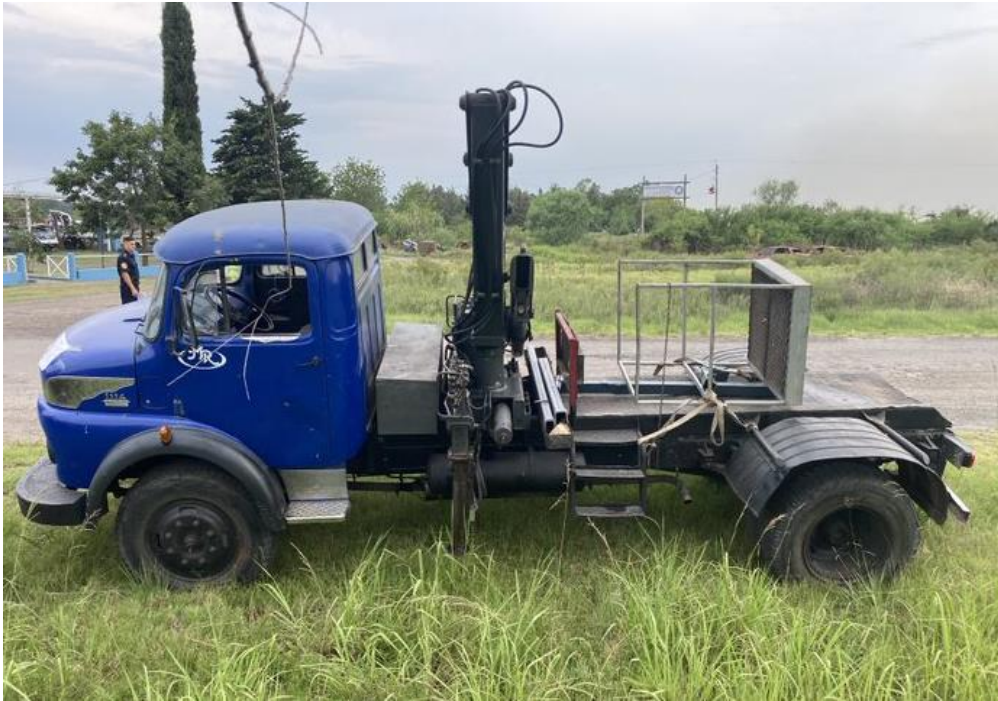
Figura 3. Camión, dominio VGY623.