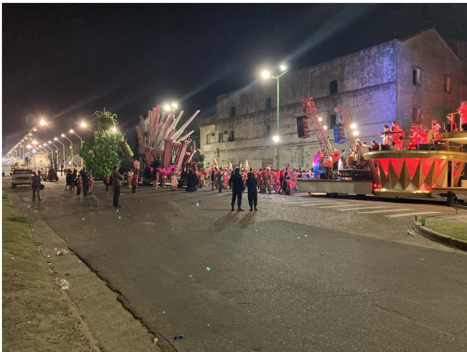
Figura 10. Imagen 2, captada en horario nocturno.