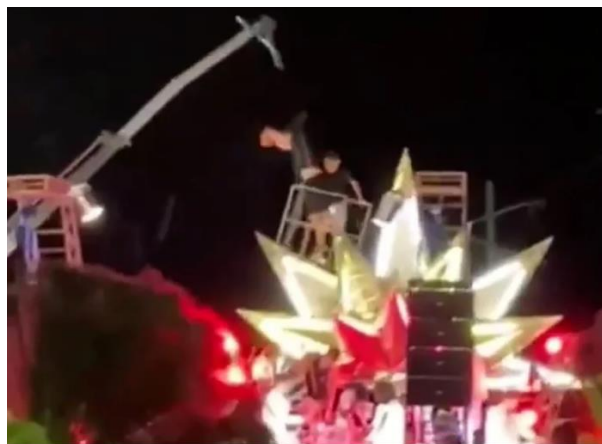
Figura 12. Secuencia del desprendimiento de la guindola (editado por la fuente periodística).