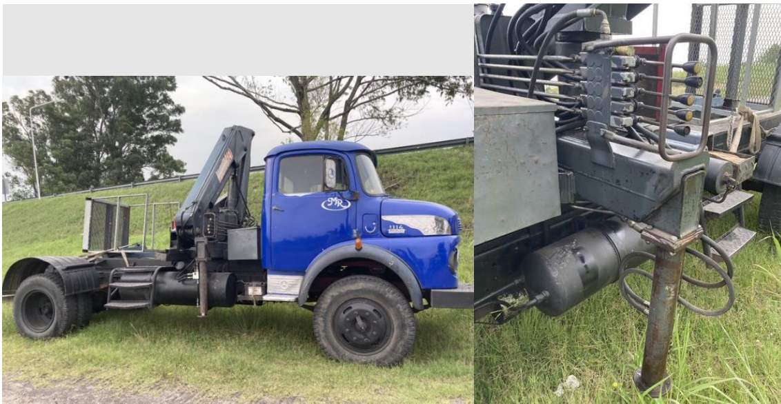
Figura 7. Camión con brazo hidráulico montado detrás de la cabina del conductor.