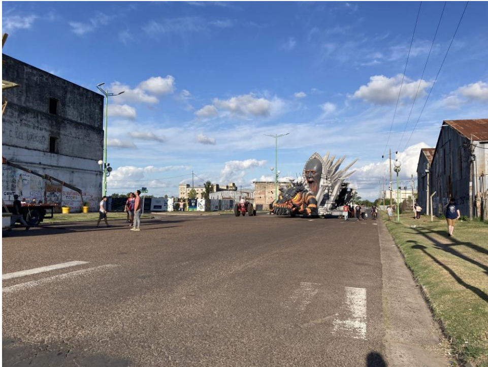
Figura 9. Imagen 1, captada en horario diurno.

Fuente: relevamiento de campo, JST, 11 de febrero 2022.