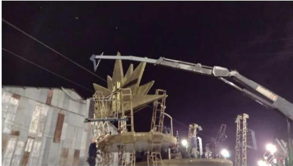
Figura 13. Secuencia del desprendimiento de la guindola (editado por la fuente periodística).