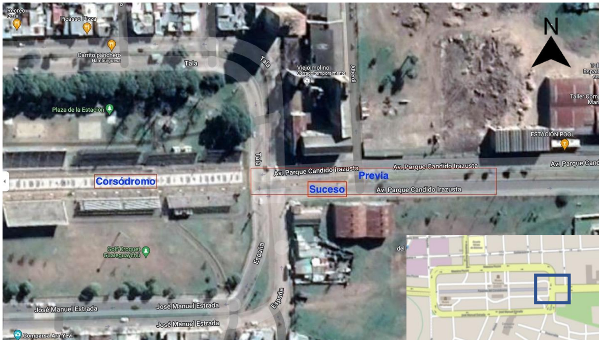
Figura 1. Imagen satelital del Corsódromo (editado por la JST).