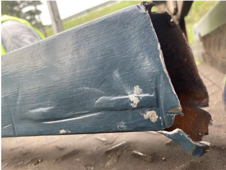
Figura 5. Sección de rotura del mástil de la guindola.

Otros daños