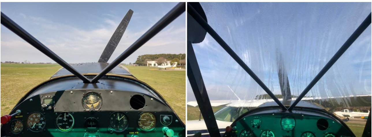
Figura 3. Visión del piloto durante el rodaje y al encontrarse con la aeronave.

La investigación obtuvo un video grabado por un testigo a través del cual se pudo observar que no existió maniobra evasiva por parte del piloto de la aeronave PA-18 matrícula LV-GDU, durante el acercamiento al LV-APM que se encontraba detenida.