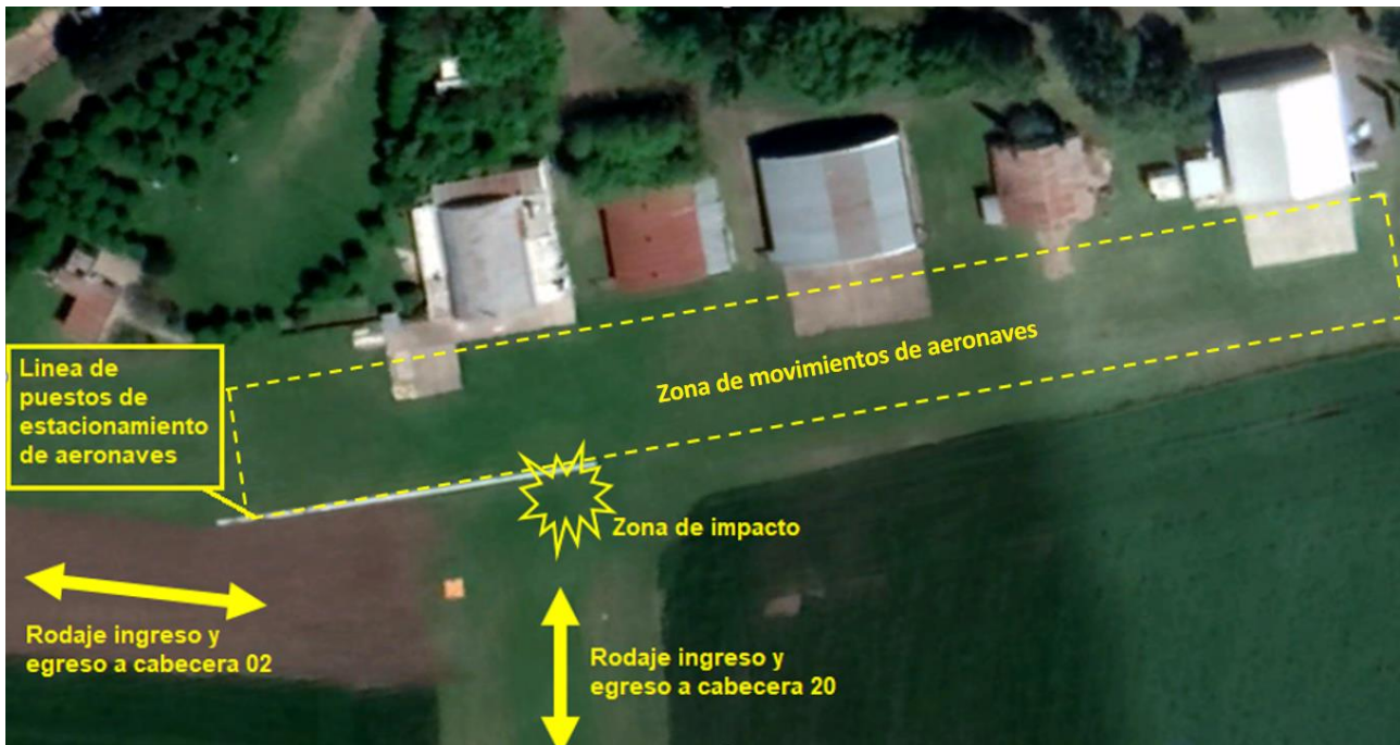
Figura 2. Zona de Impacto, intersección calles de rodaje. 20-02 y Movimiento de Aeronaves

De acuerdo con la entrevista realizada al piloto del PA-18 matrícula LV-GDU, se pudo evidenciar que se encontraba en rodaje para pista 02. Durante ese trayecto, el piloto no visualizó que se encontraba la aeronave C152 LV-APM detenida en la línea designada para puesto de estacionamiento.