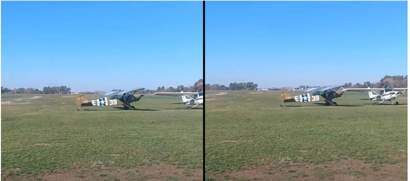
Figura 4. Imágenes captadas del video del testigo

Con respecto a la infraestructura del aeródromo y su área operativa, el equipo de investigación realizó un relevamiento completo de las condiciones. Entre los hallazgos significativos se identificó que las dimensiones tomadas en el lugar indicaron que entre la última baliza de la calle de rodaje hacia la pista 20 y la línea designada para puesto de estacionamiento existía una distancia de 28 metros.