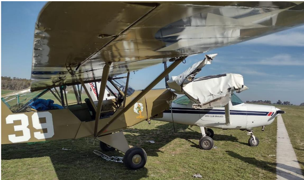
Figura 1. Posición final de las aeronaves involucradas

En el trayecto de rodaje hacia la cabecera de la pista 02 del aeródromo de Bragado, la aeronave impactó con la hélice el plano derecho de la aeronave Cessna C 152-A matrícula LV-APM que se encontraba estacionada en la línea designada para puesto de estacionamiento.