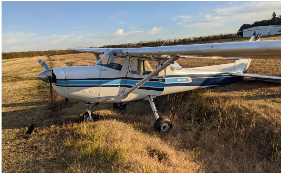
Figura 1. Posición final de la aeronave involucrada en el accidente.

El accidente ocurrió de día y en condiciones de buena visibilidad.