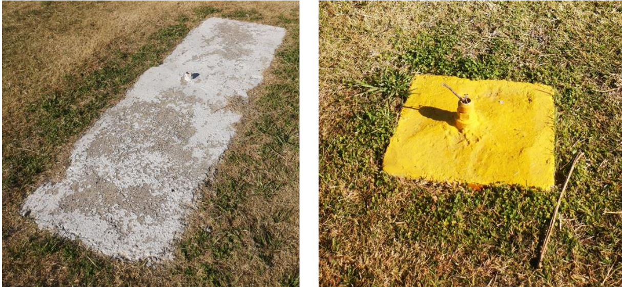
Figura 8. Ejemplo de balizas rotas en el aeródromo de Mercedes.

De igual forma, se observó que el sistema de iluminación del aeródromo se encontraba deteriorado, con numerosas balizas rotas y fuera de funcionamiento.