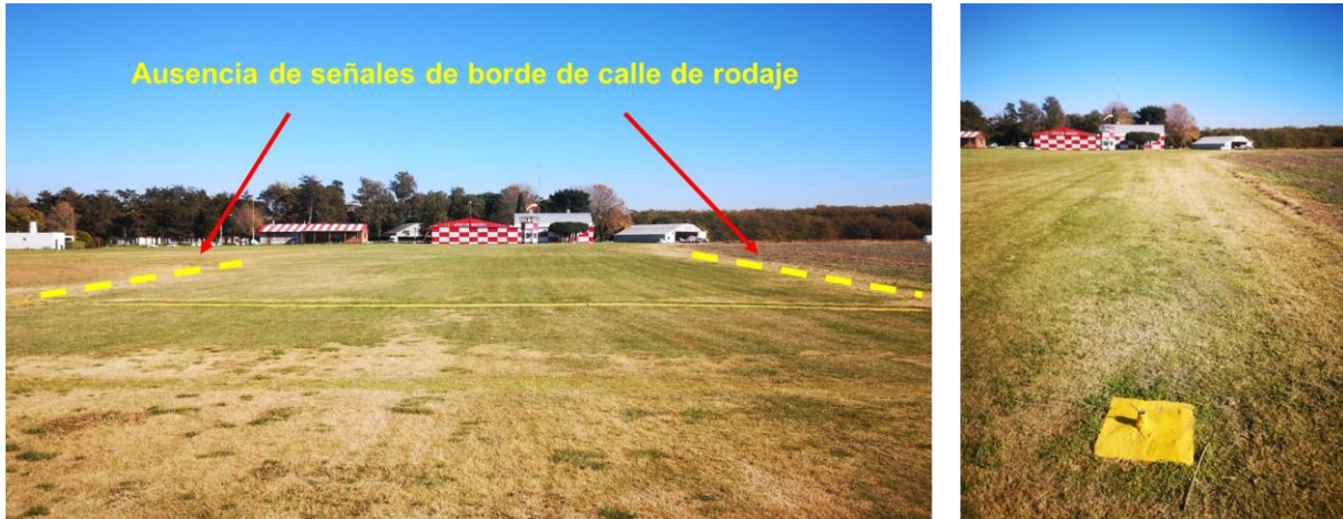
Figura 3. Ausencia de señalización de borde de calle de rodaje.

Durante el trabajo de investigación en campo se observó que los bordes de la calle de rodaje por la que circulaba la aeronave no se encontraban señalizados.