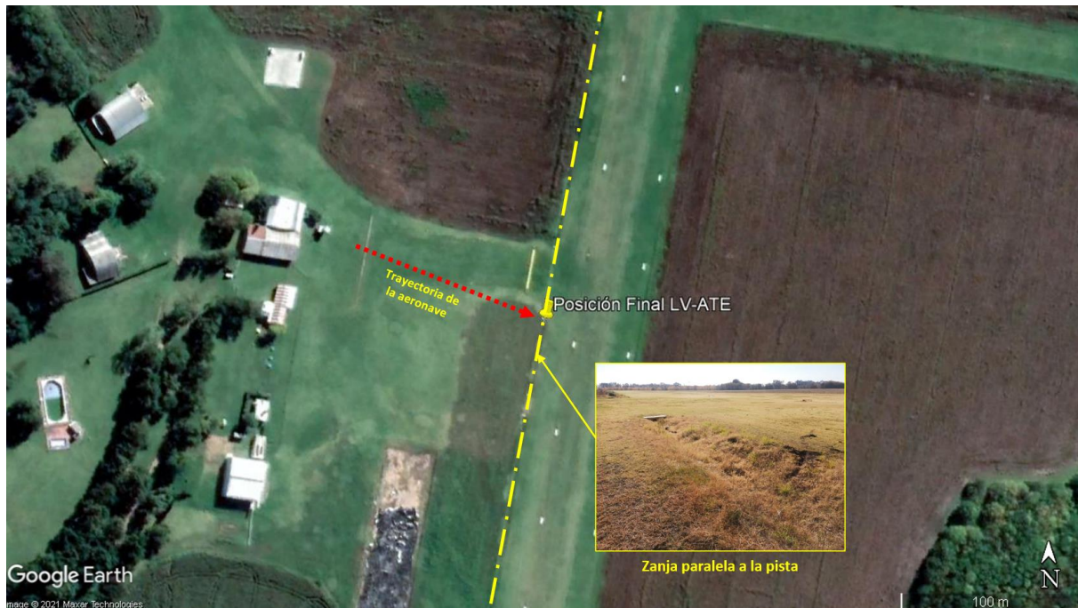
Figura 2. Trayectoria y posición final de la aeronave.

Como consecuencia del accidente, la aeronave experimentó daños de importancia en el tren de aterrizaje de nariz y la bancada del motor.