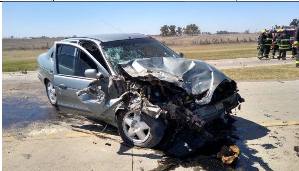
Figura 2. Posición final del Vehículo 2.