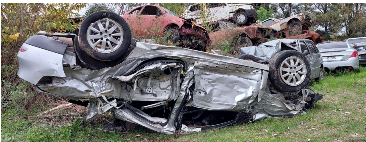
Figura 14. Deformaciones en el lateral izquierdo.