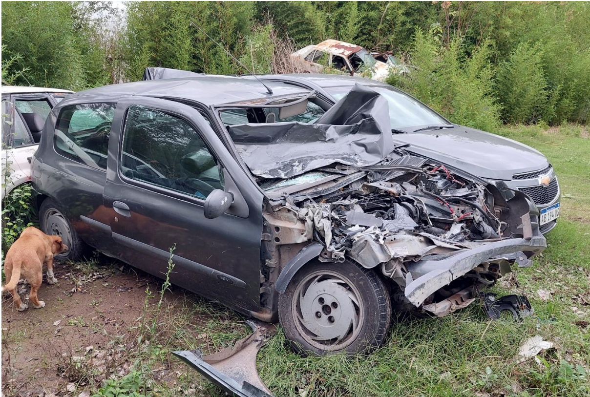
Figura 12. Vista de las deformaciones desde el sector anterolateral derecho.