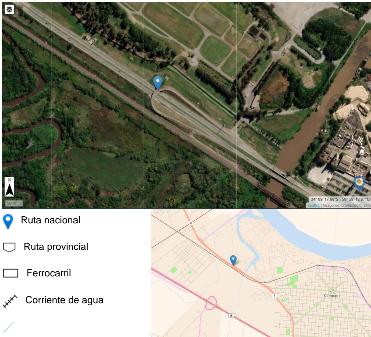
Figura 2. Mapa de localización del suceso.