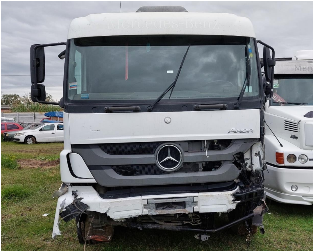
Figura 7. Daños adquiridos en el choque contra la barrera de contención y la colisión con el Vehículo 2 y el Vehículo 3.

En la unidad tractora se observaron daños que incluyen rotura de paragolpes, alma de paragolpes, ambos estribos y rueda delantera derecha.