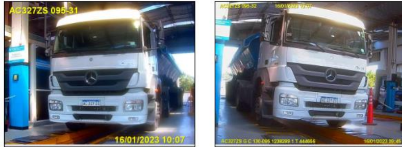
Figura 5. Fotovalidación del tractor dominio AC327ZS.

Fecha Revisión: 16/01/2023 Fecha Vencimiento: 16/01/2024 Resultado: Apto Tipo de Uso: GC (Carga Interjurisdiccional) Certificado: T 444656 Taller: (095) La Verificadora del Norte S.R.L.