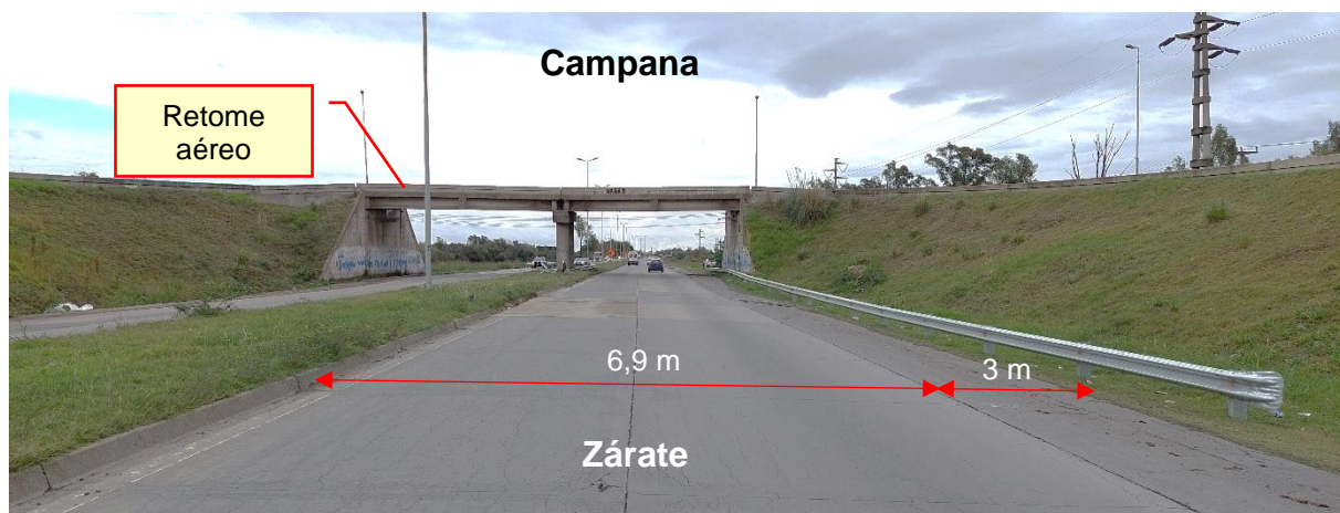
Figura 3. Características de la vía en el sentido de circulación del Vehículo 1.

Se relevó señalización horizontal despintada. No se observó señalización vertical en las proximidades de la zona del suceso.