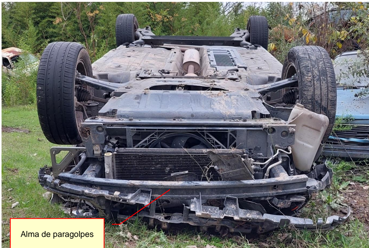
Figura 13. Vista de las deformaciones desde el sector anterior. Se observó el alma del paragolpes sin deformación.

Se relevaron deformaciones en el capó y desprendimiento del paragolpes. En el lateral izquierdo se observaron daños en toda su extensión, con una fuerza de deformación con sentido desde el sector anterior hacia el sector posterior.