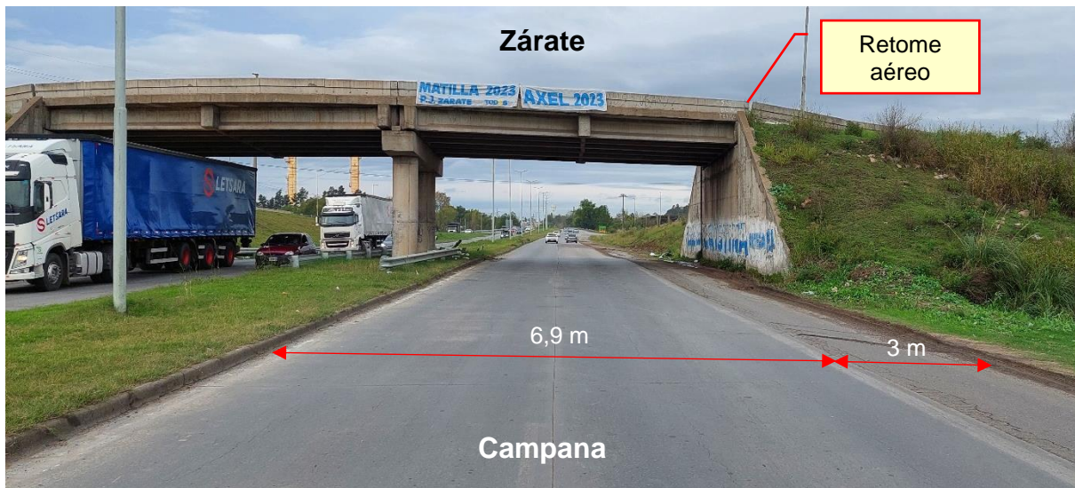
Figura 4. Características de la vía en el sentido de circulación de los Vehículos 2 y 3.