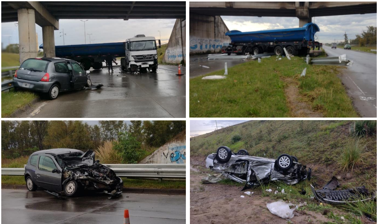
Figura 18. Posiciones finales de los vehículos participantes en el suceso.