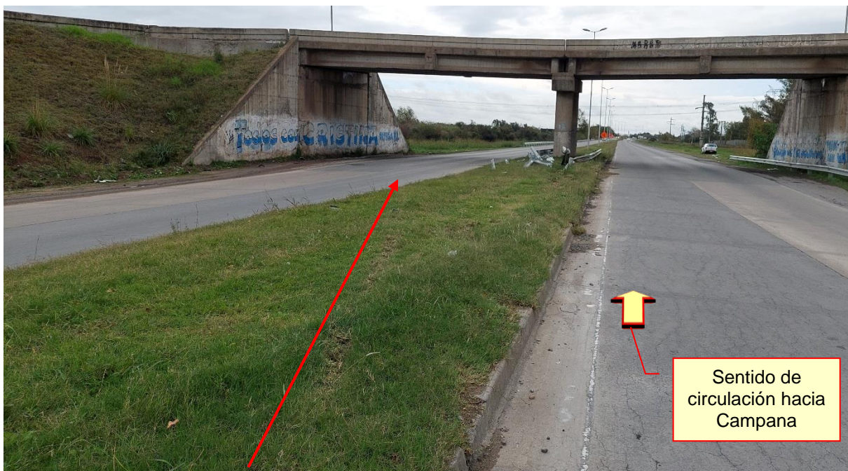
Figura 16. Continuación de las huellas del Vehículo 1 sobre el cantero central.