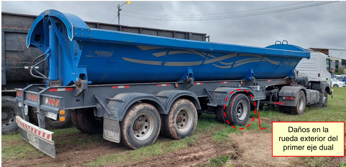
Figura 9. Lateral derecho del semirremolque. Par de ruedas duales con daños.

En el semirremolque se relevó rotura del primer par de ruedas duales del lateral derecho.