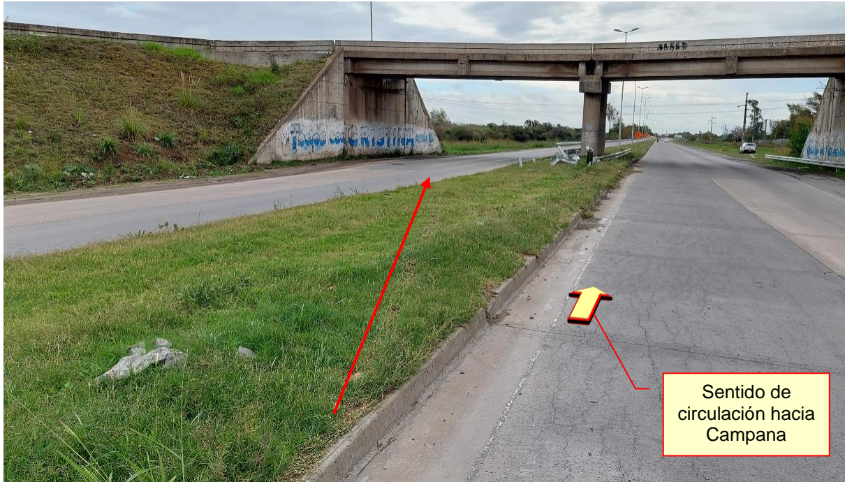
Figura 15. Inicio de las huellas del Vehículo 1 sobre el cantero central.

reposito 26 m hacia la localidad de Zárate desde el puente de retome, apoyado sobre el techo y con su sector anterior en dirección a la localidad de Campana.