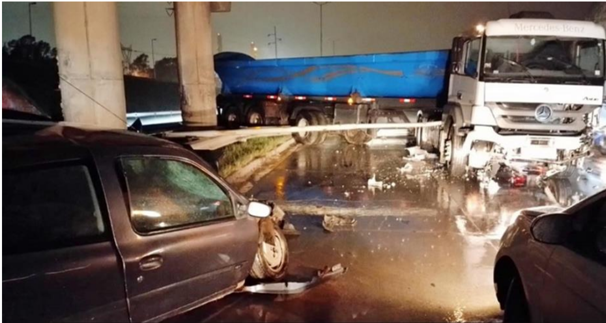
Figura 1. Posiciones finales de los vehículos 1 y 2.