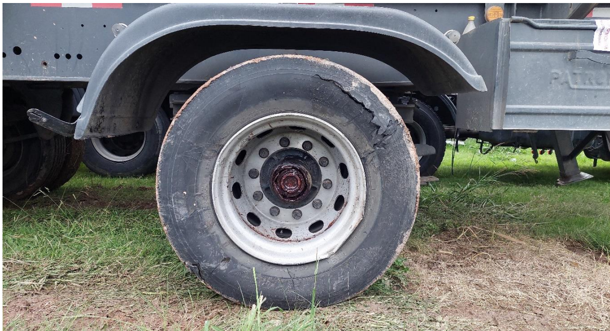
Figura 10. Detalle de las deformaciones de la rueda externa.