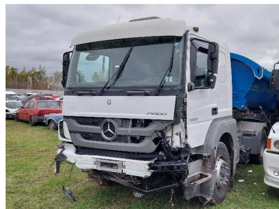
Figura 8. Extensión de los daños hacia los laterales.