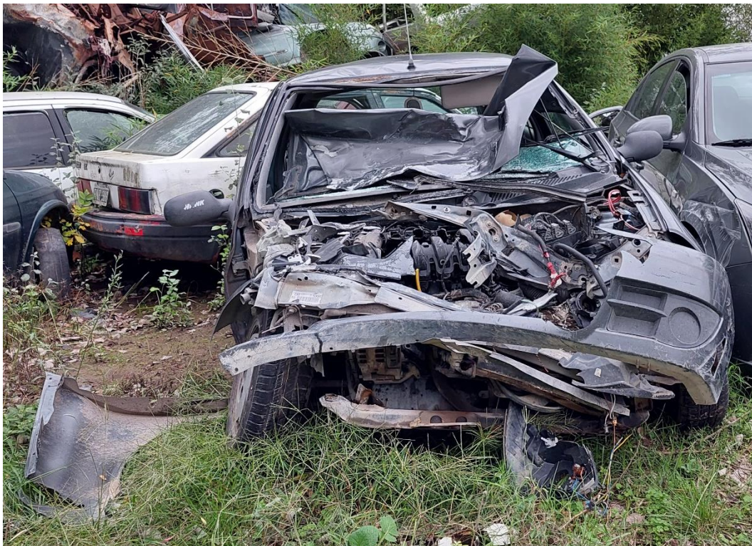
Figura 11. Deformaciones del sector anterior.

Se observó desprendimiento de capó, guardabarros derecho y parabrisas y daños en el paragolpes y en la carrocería autoportante.