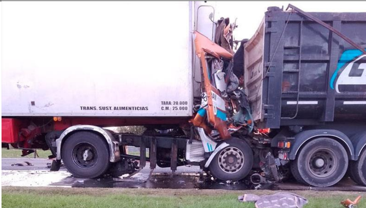
Figura 1. Posición final de los vehículos.