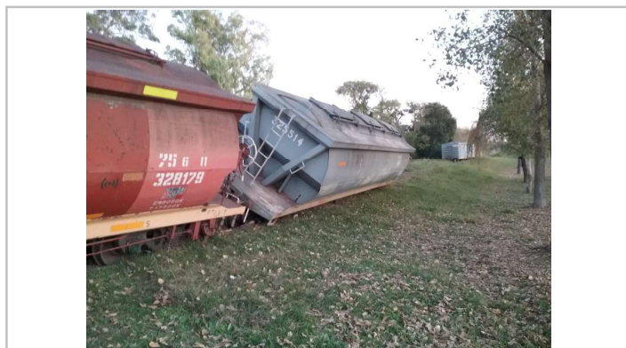
Figura 2. Vagones n.º 46 y n.º 45 descarrilados, en el orden del sentido de la marcha del tren.