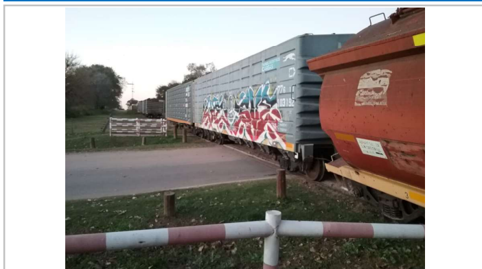
Figura 1. Vista del PAN afectado por los vagones descarrilados.