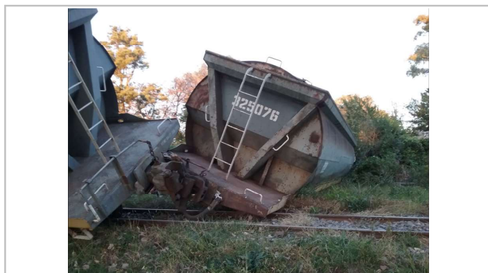
Figura 4. Detalle de los vagones n.º 45 y n.º 44 descarrilados, en el orden del sentido de la marcha del tren.