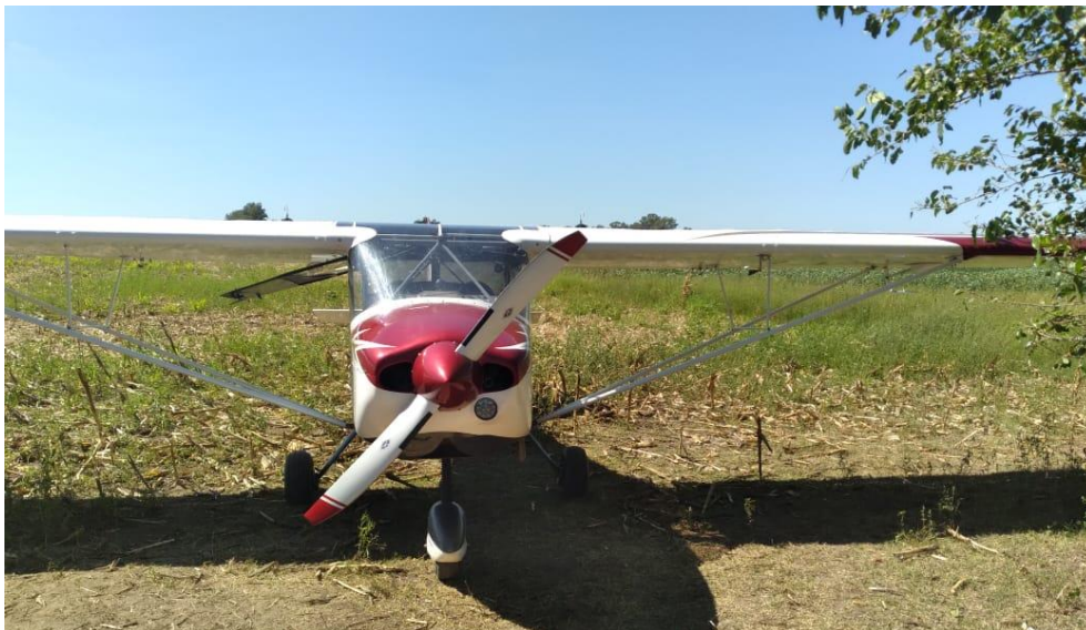
Figura 1. El LV-ITP luego del aterrizaje de emergencia en Timbúes.

Al momento de la falla, la aeronave se encontraba con 1.000 pies de altura y con proa a la pista 09 del aeroclub de San Lorenzo (provincia de Santa Fe). La piloto tomó diferentes acciones para revertir la condición del motor: un intento de reencendido y el cambio de tanque de combustible, pero ninguna tuvo el efecto esperado. Por esta razón, realizó un aterrizaje de emergencia en un lote con rastrojos de soja resultando sin daños en la aeronave ni lesiones a las personas a bordo.