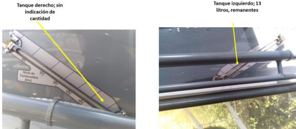
Figura 2. Imagen de los indicadores de combustible luego del aterrizaje de emergencia.