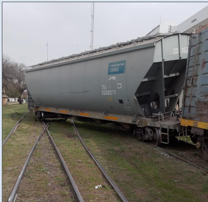
Figura 2. Vagón del tren H63 descarrilado sobre la vía 3 de la playa Venado Tuerto.