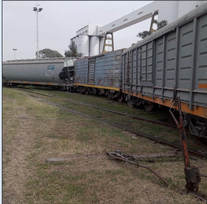
Figura 1. Imagen del descarrilamiento y choque en la playa Venado Tuerto.