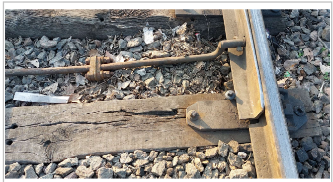
Fig. 4. Aguja del aparato de vía asegurada provisoriamente, JST