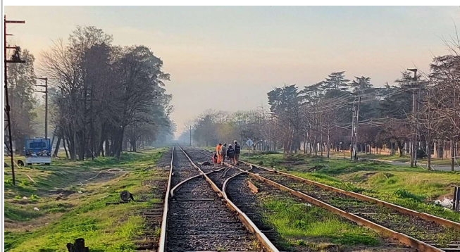
Fig. 1. Aparato de vía donde ocurrió el descarrilamiento, JST