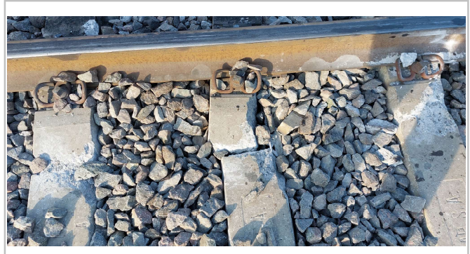
Fig. 2. Marcas del paso de los bogies descarrilados sobre los durmientes, JST