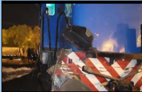
Figura 4. Daños de la máquina del tren.