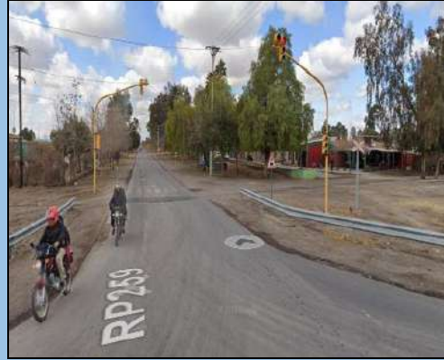
Figura 1. PAN RP259.