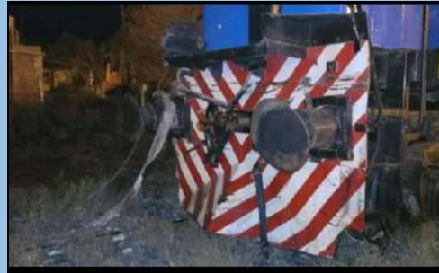
Figura 3. Daños de la máquina del tren.