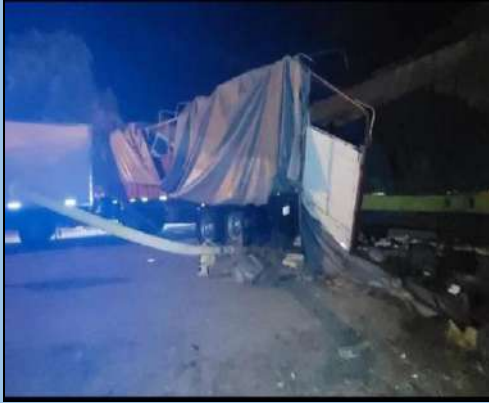
Figura 2. Acoplado del camión después de la colisión.