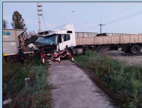
Figura 1. Daños estructurales sobre el camión y el laberinto peatonal. Fuente: enteriosya.com.ar , 19 de agosto de 2023