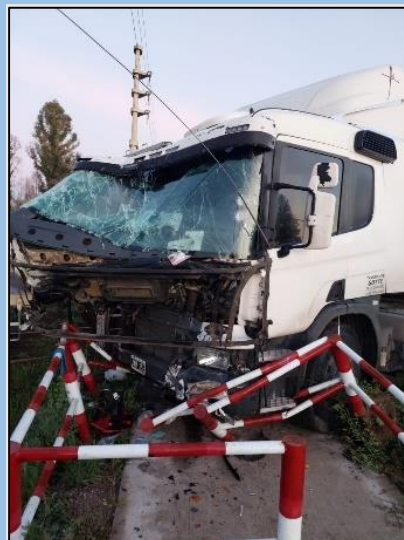
Figura 2. Acercamiento. Daños estructurales sobre el camión y el laberinto peatonal.