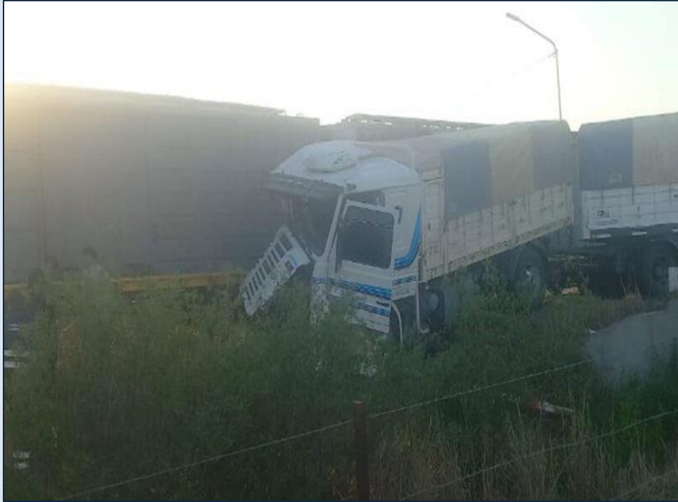
Figura 1. Camión involucrado en el suceso.