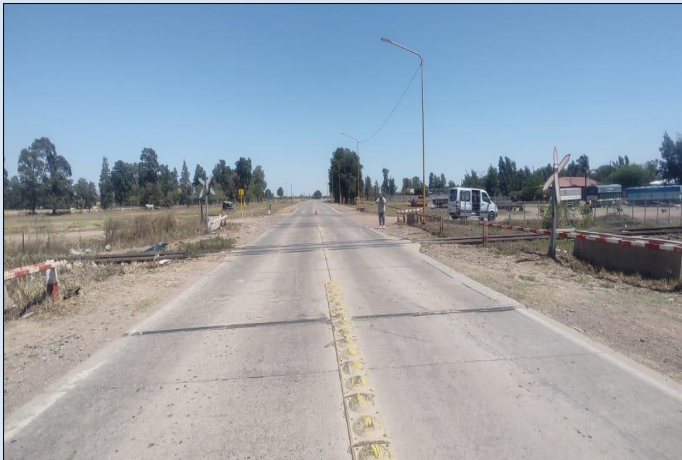
Figura 2. Paso a nivel de la Ruta Provincial 2.