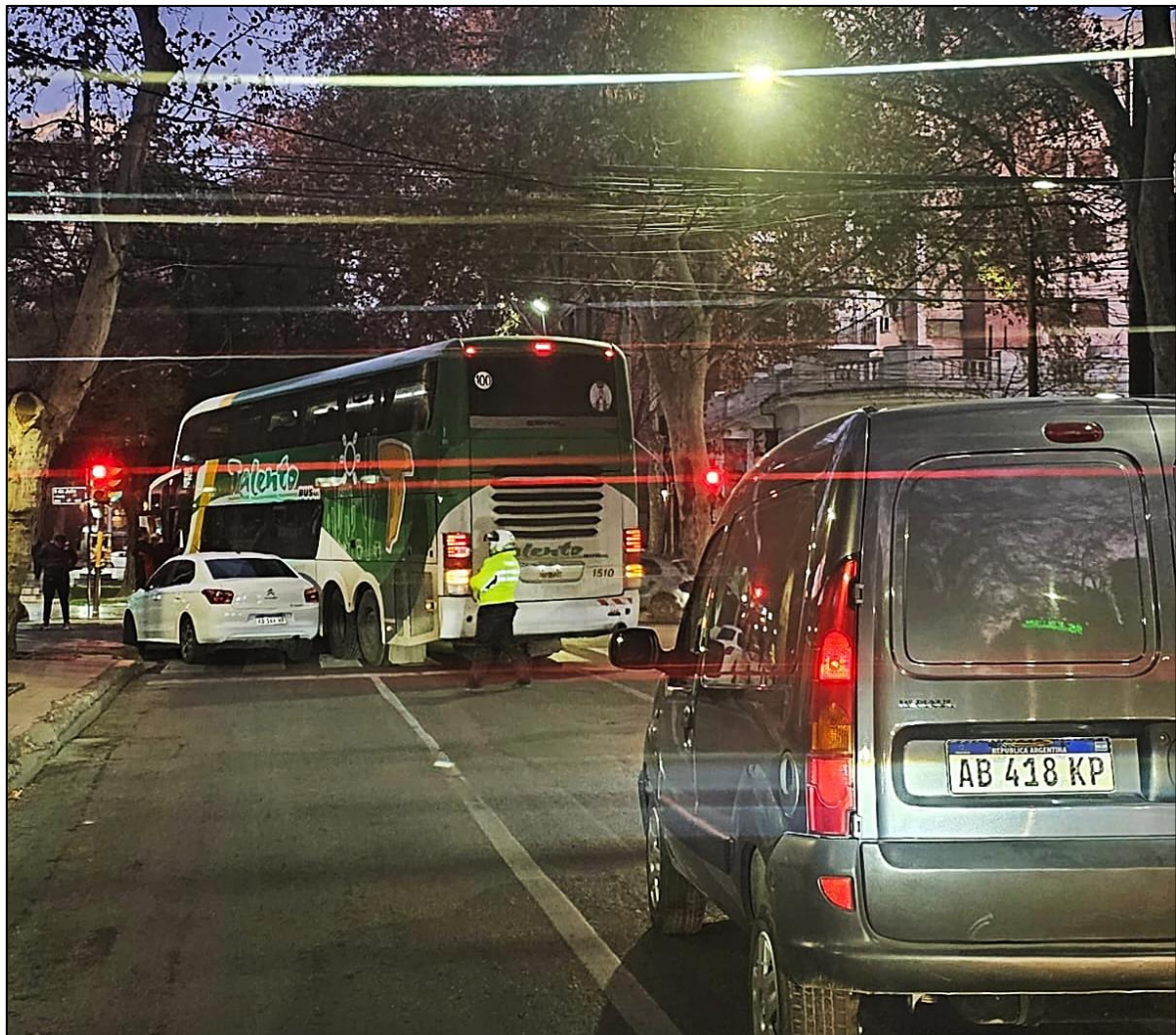
Figura 1. Vista general de calle Montevideo de este a oeste.