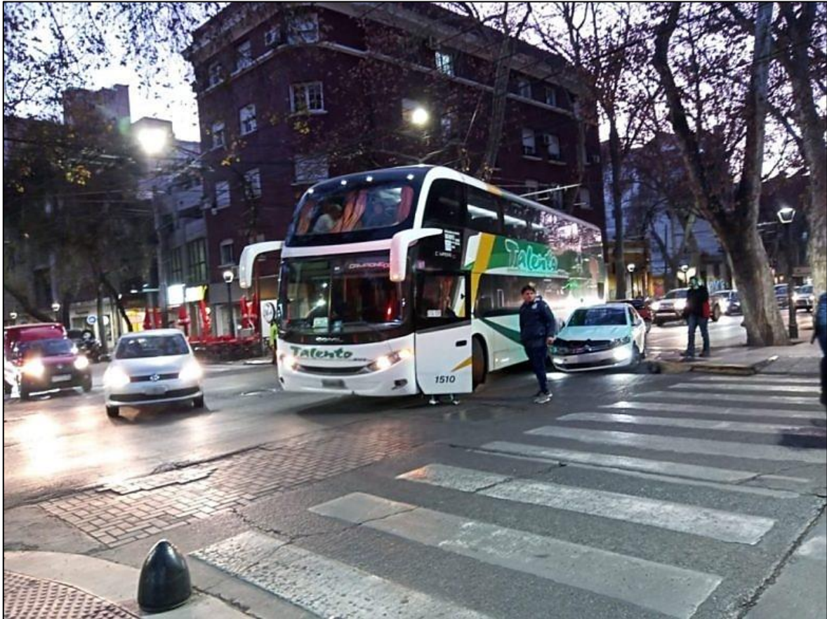
Figura 2. Posición final de los vehículos involucrados.