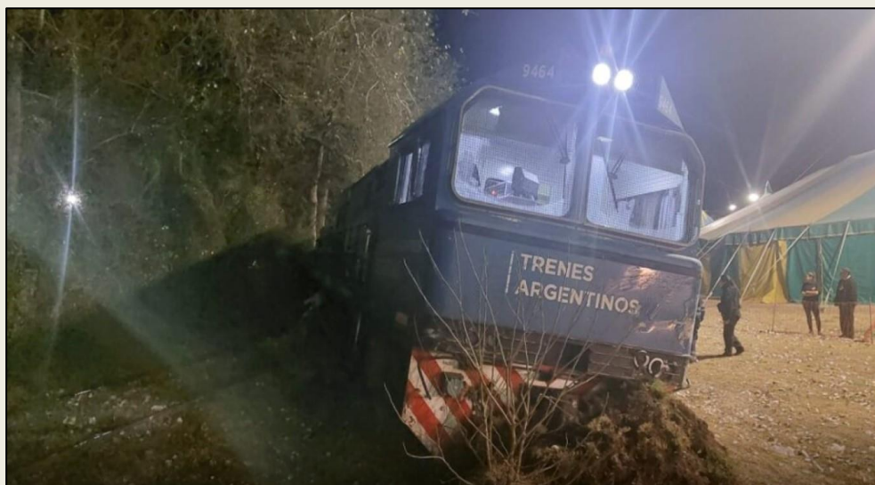
Figura 3. Posición final de la locomotora.