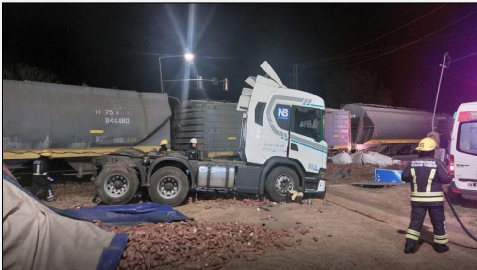
Figura 1. Posición final de los vehículos involucrados.