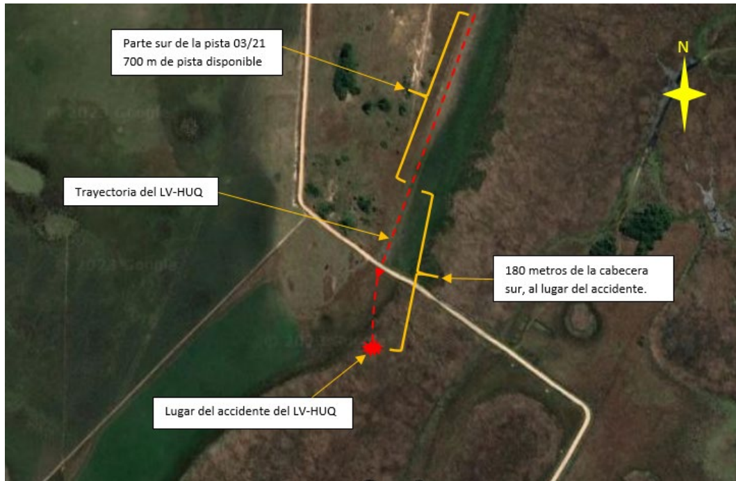
Figura 3. Croquis del segundo intento de despegue y posterior impacto con el terreno.

unos 180 metros de la cabecera 03 en un bañado situado junto a la pista, desplazado aproximadamente 15° hacia la izquierda con respecto a la prolongación del eje de la pista.