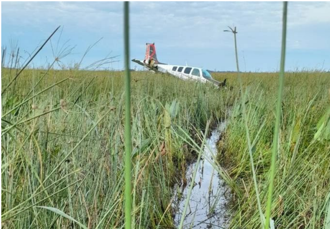
Figura 4. Marca dejada en el terreno por el LV-HUQ.