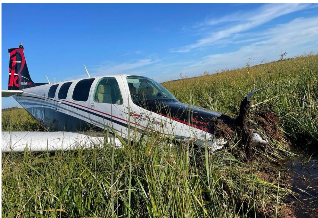
Figura 1. Posición final del LV-HUQ.

El accidente ocurrió de día y con buenas condiciones meteorológicas. Tanto el piloto como los pasajeros resultaron ilesos y lograron abandonar la aeronave por sus propios medios. Como consecuencia del suceso, la aeronave resultó con daños de importancia.