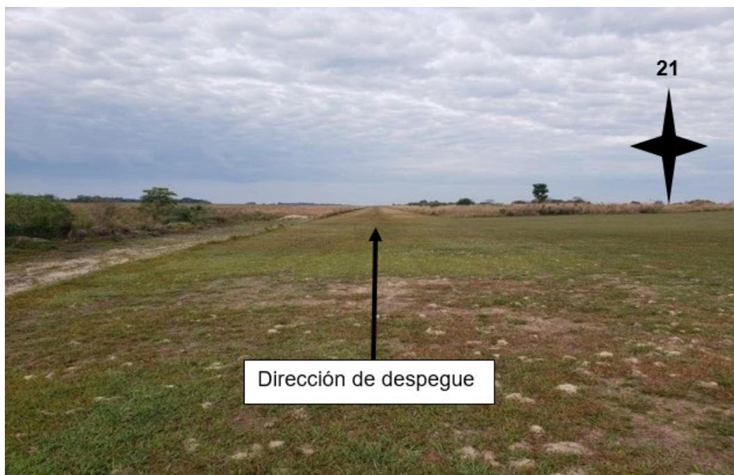
Figura 2. Posición desde la cual el LV-HUQ inició su segunda carrera de despegue.

Durante la carrera de despegue y tras recorrer unos 400 metros, el piloto decidió abortar la maniobra y retroceder nuevamente hasta la cabecera norte. En esta ocasión, optó por posicionarse detrás del umbral de la cabecera con el fin de obtener algunos metros adicionales para facilitar el despegue.