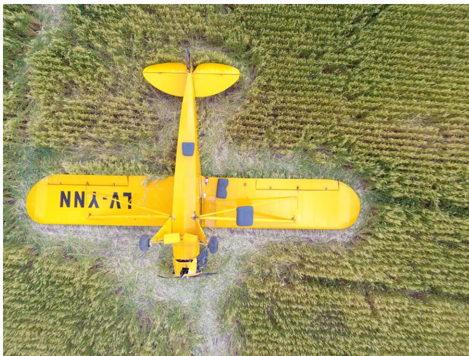
Figura 1. Aeronave involucrada en el accidente.

El accidente ocurrió de día y en buenas condiciones meteorológicas.