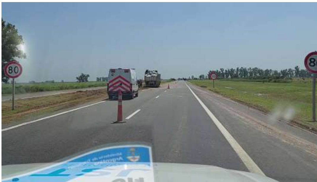
Figura 7. Fotograma que ilustra la zona de vuelco de un camión en cercanías al suceso.

Es relevante agregar que, aproximadamente a las 02:00 del día 17/02/22, mientras se realizaba el operativo de rescate de las personas involucradas en el suceso, un camión con semirremolque que trasladaba chatarra desde Buenos Aires hasta Salta, se vio involucrado en un vuelco sobre la misma vía, unos 380 m antes de la zona de posición final del ómnibus (Figura 7). La relevancia de este segundo suceso se profundizará en el Informe de Seguridad Operacional.