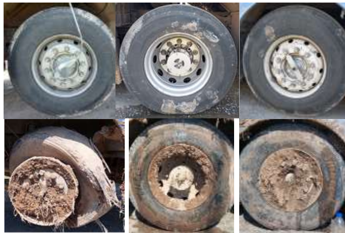
Figura 5. Registro de neumáticos del vehículo.