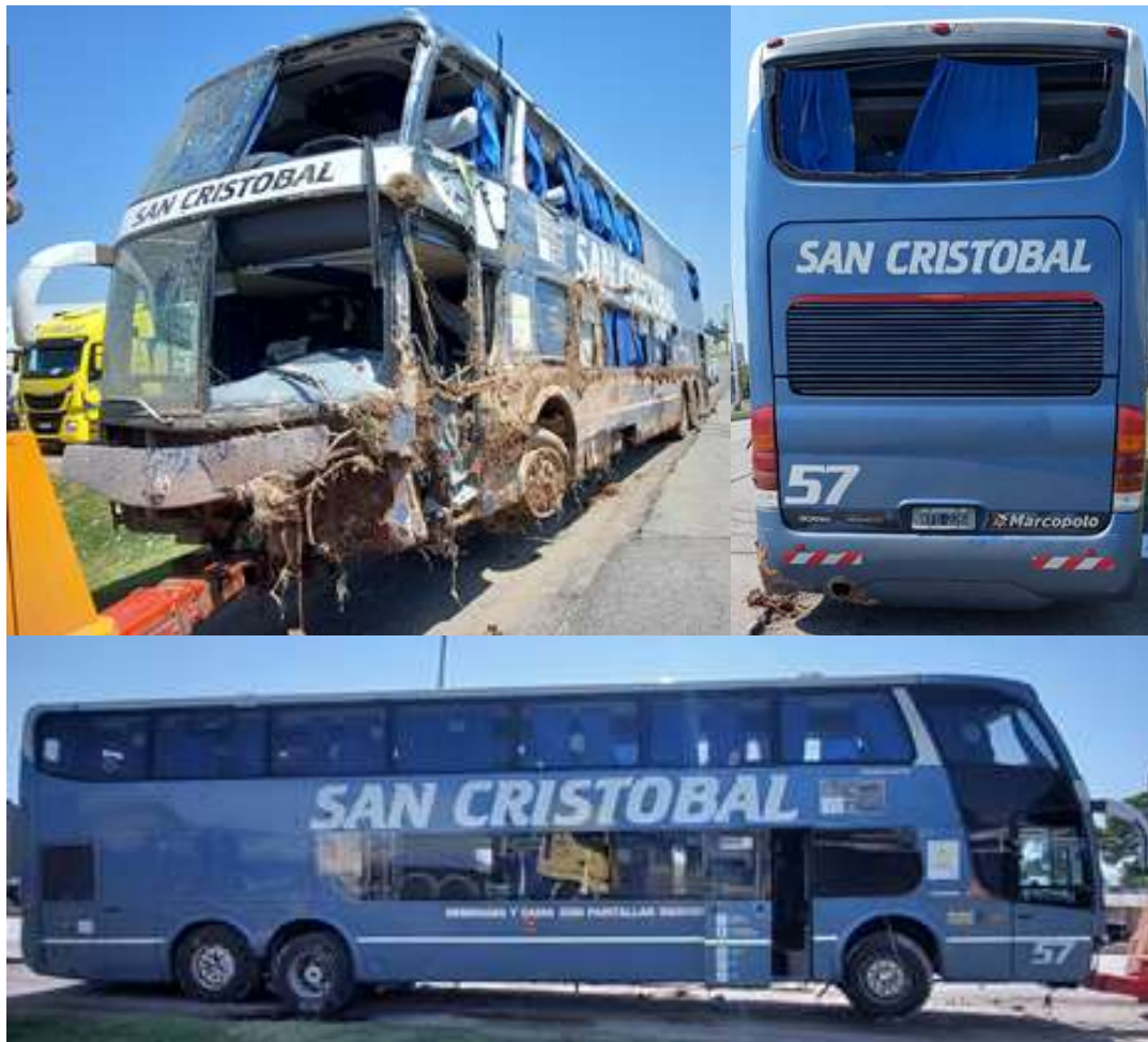
Figura 4. Registro visual externo del vehículo.

Se realizó inspección inicial del estado de conservación de los neumáticos de la unidad (Tabla 3), tarea dificultada por la gran cantidad de barro depositado del lado izquierdo y el estado general del neumático delantero izquierdo que sufrió la avería (Figura 5). Se recolectó información sobre profundidad de dibujo y presión de inflado, así como el código DOT (Department Of Transportation), incluida la fecha de fabricación cuando esto fue posible. Se conservaron restos del neumático delantero izquierdo para estudio posterior, que se detallará en el informe final.