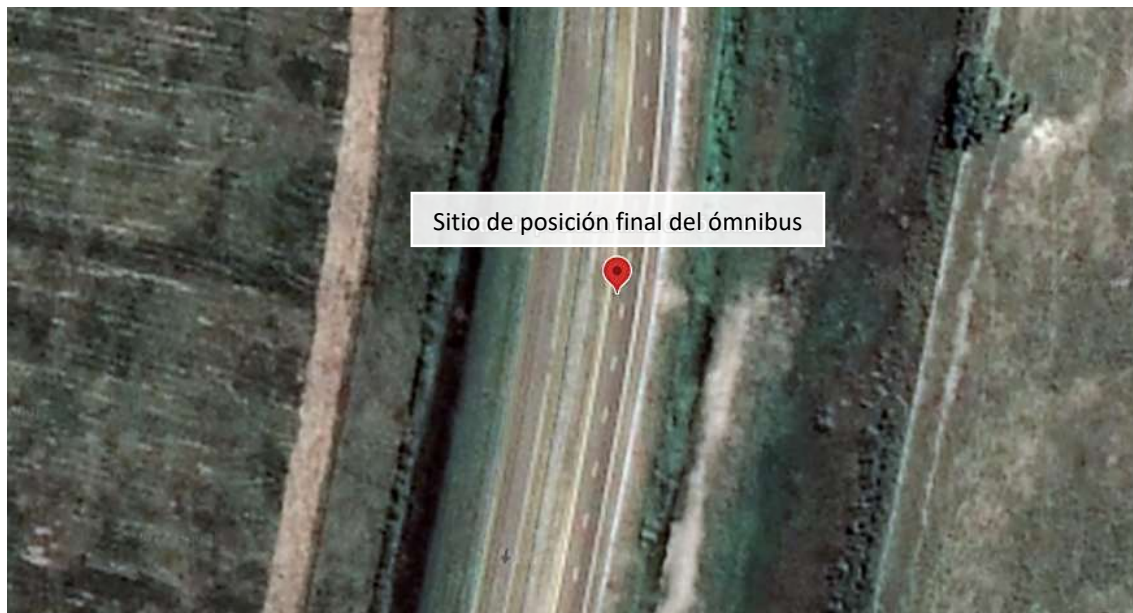
Figura 1. Posición final de la unidad involucrada.

Como consecuencia del suceso, 8 pasajeros resultaron con heridas, mientras que ambos conductores y los restantes 42 pasajeros resultaron ilesos.