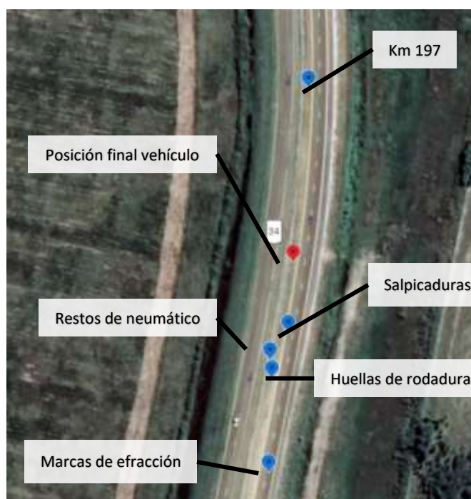
Figura 6. Infografía de la posición relativa de algunos indicios relevados sobre la vía y cantero central.

Finalmente, el vehículo continuó su trayectoria posvuelco, arrastrando su lateral izquierdo contra el cantero central, apoyado sobre una barrera semirrígida, deteniéndose completamente, con su frente orientado hacia el cardinal norte. Esta última etapa de la dinámica fue posible de reconstruir mediante las marcas sobre el cantero central, los daños en la barrera semirrígida y los daños constatados en el vehículo.