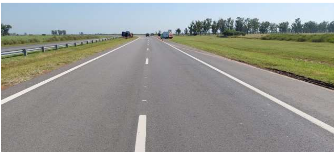
Figura 3. Geometría, configuración y estado de la vía. Carriles de circulación sur-norte.

La configuración, estado y mediciones de la vía se ampliarán más adelante en esta investigación.