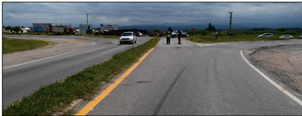
Figura 2. Sector de circulación del camión previo al despiste.