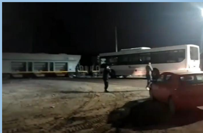
Figura 1. Posición final de los vehículos tras la colisión.

Fuente: Tiempo de San Juan , 11 de agosto 2022