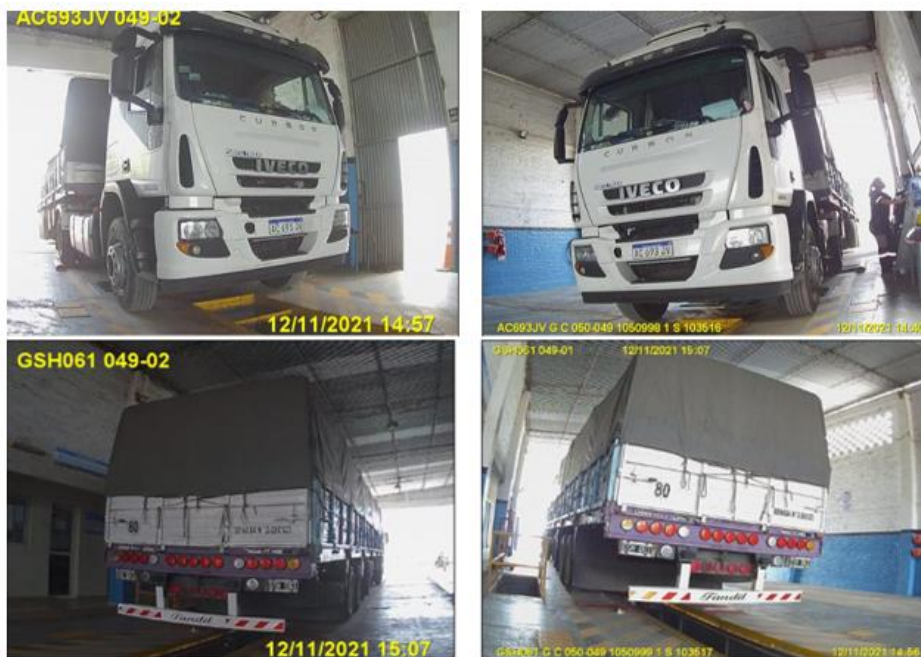
Figura 9. Fotovalidación del Vehículo 1 durante la Revisión Técnica Obligatoria.