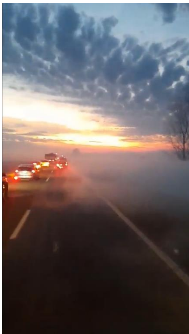
Figura 7. Vía de circulación momentos posteriores a la ocurrencia del suceso con presencia de neblina.