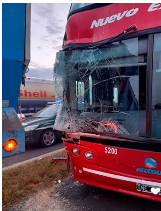
Figura 21. Posición final de los vehículos 3 y 6.