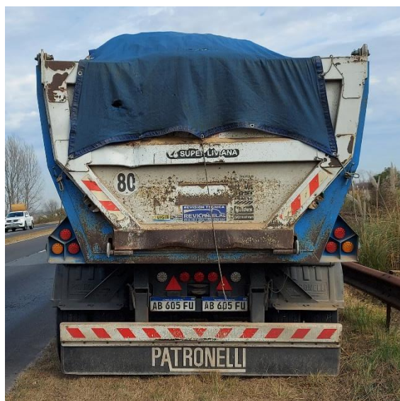
Figura 12. Fotografías del Vehículo 3.