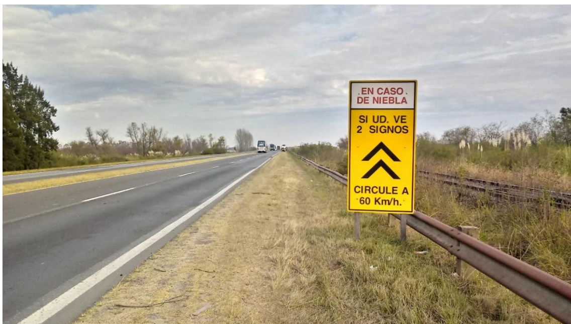
Figura 5. Señalización vertical preventiva en caso de visibilidad reducida.

Al momento del suceso, las condiciones meteorológicas eran de cielo parcialmente nublado con neblina, con calzada seca y horario del amanecer, sin ángulo solar que propicie encandilamiento. Los vehículos se encontraban conduciendo con una visibilidad reducida producto de la neblina y de humo que había en la zona producto de quema en la zona.