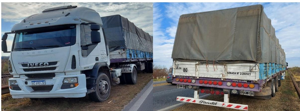
Figura 8. Fotografías del Vehículo 1.