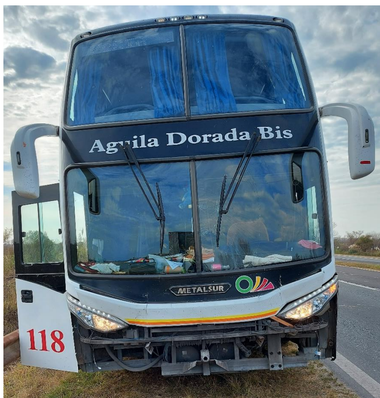
Figura 16. Fotografía del frente del Vehículo 5.