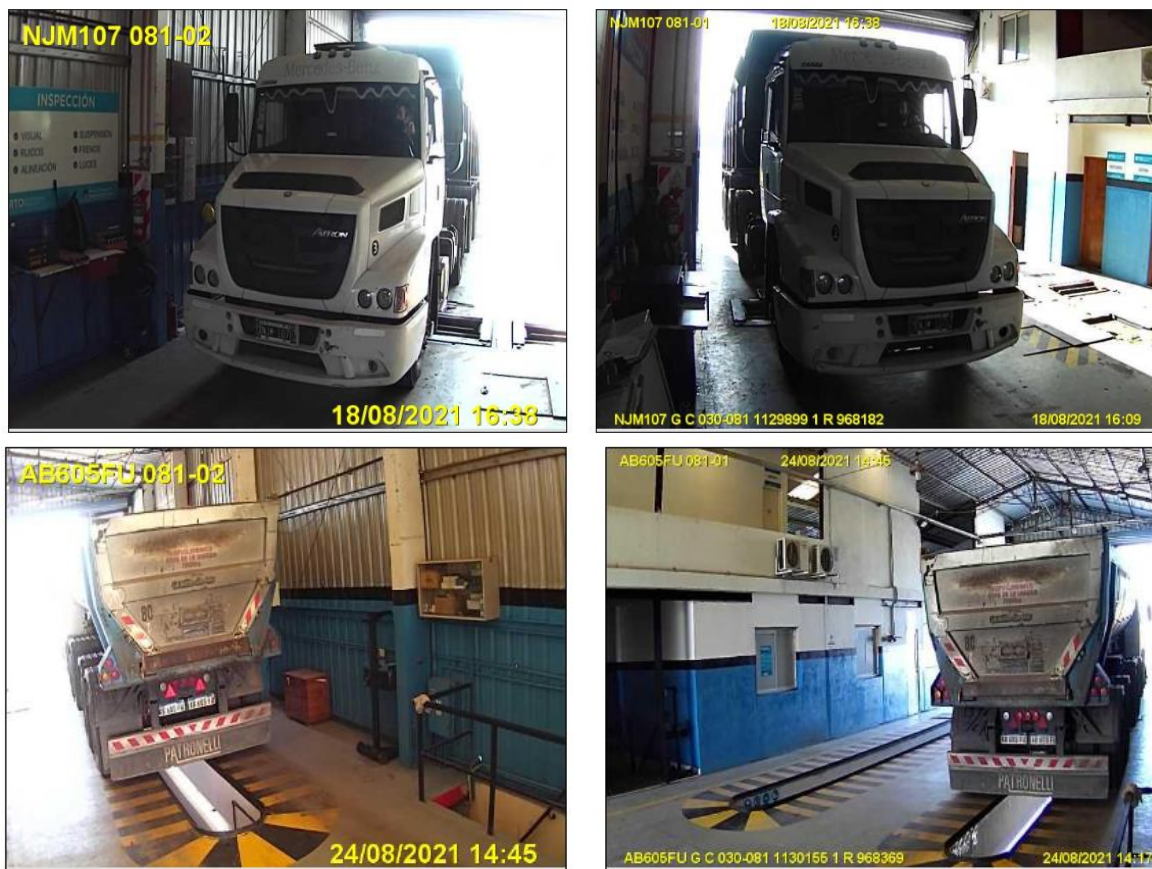
Figura 13. Fotovalidación del Vehículo 3 durante la Revisión Técnica Obligatoria.