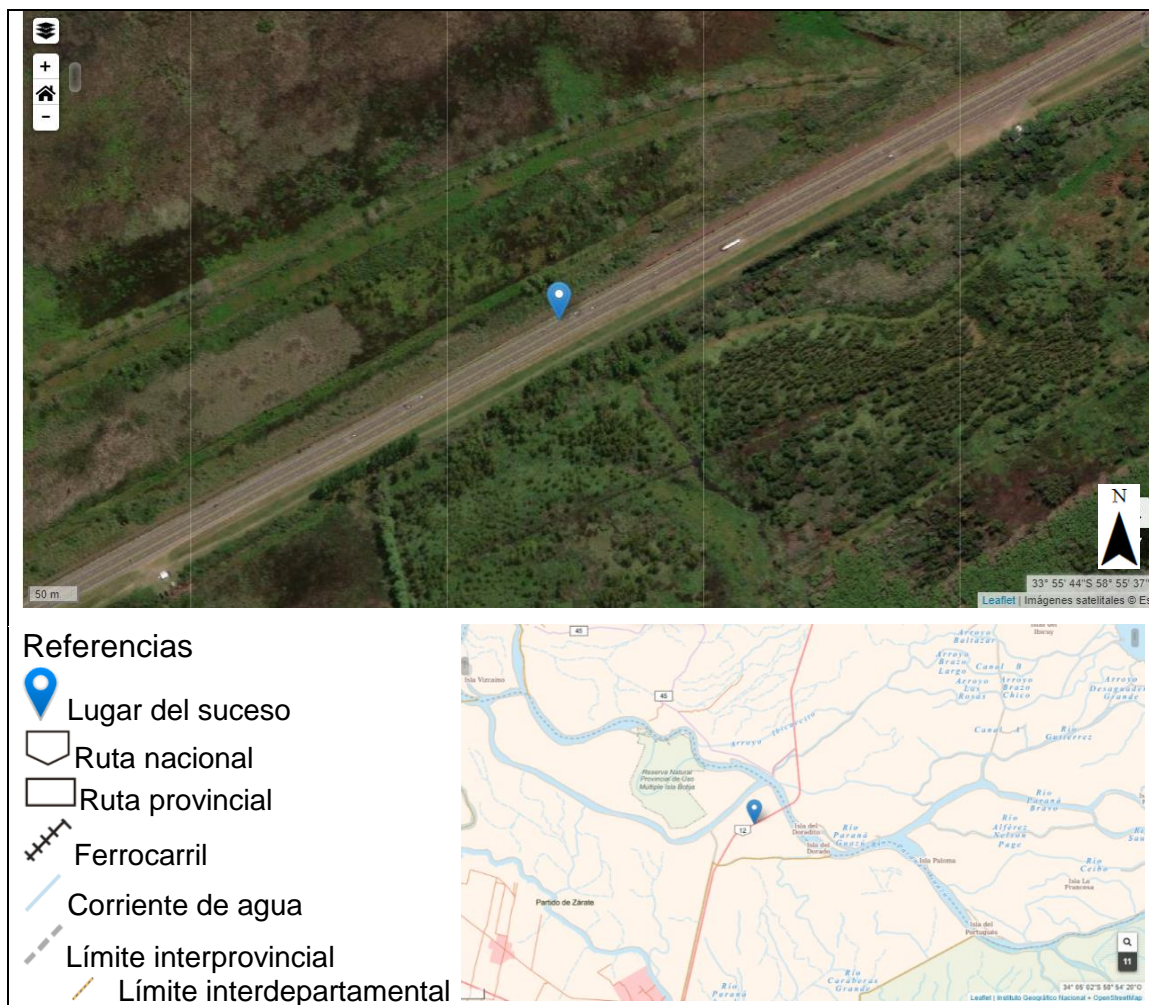
Figura 3. Localización del suceso en mapas.