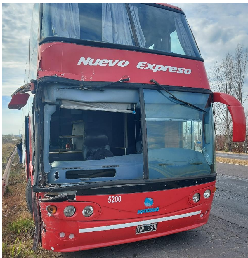
Figura 18. Fotografía del frente del Vehículo 6.