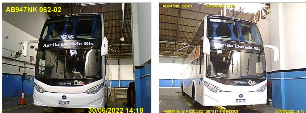
Figura 17. Fotovalidación del Vehículo 5 durante la Revisión Técnica Obligatoria. Fuente: RTO, CENT, 2022