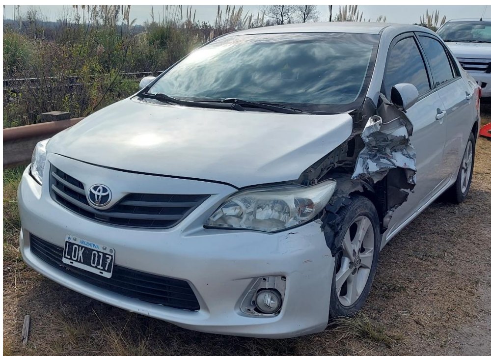
Figura 20. Fotografía del Vehículo 8.