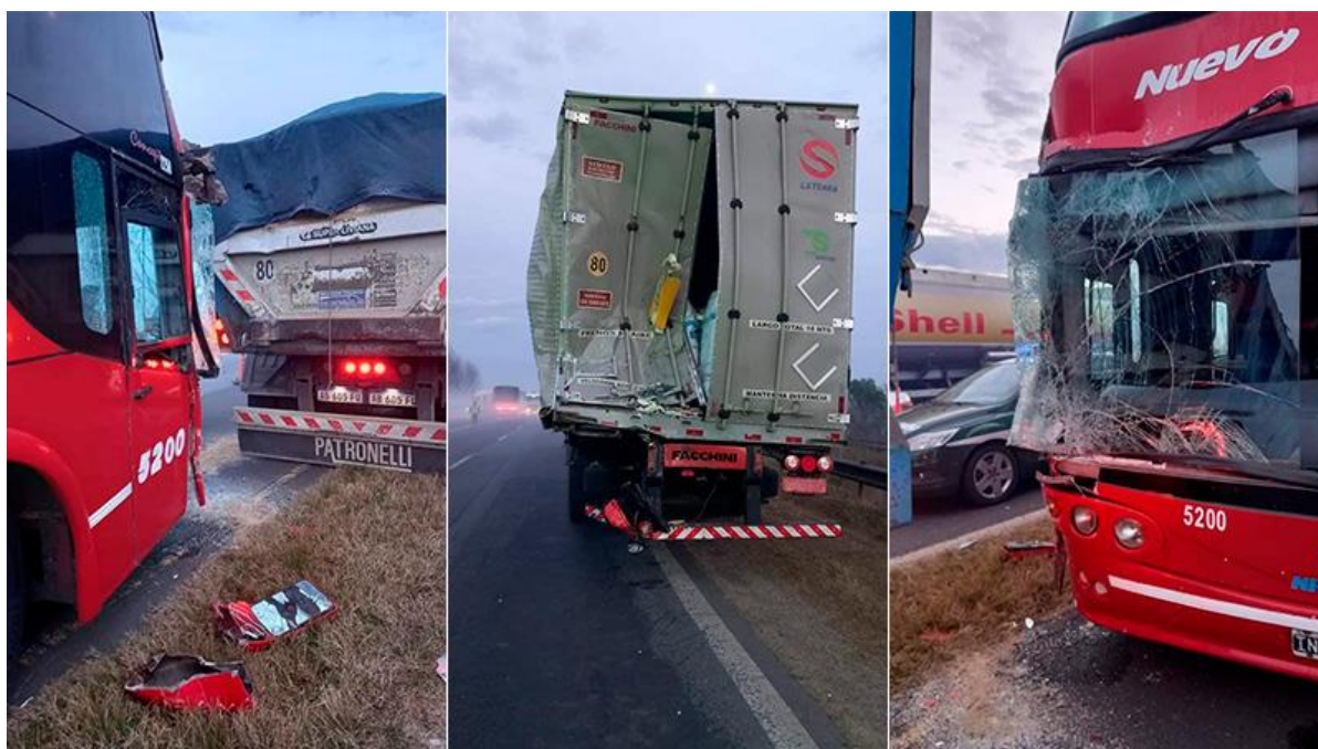
Figura 23. Posición final de los vehículos 2, 3 y 6.