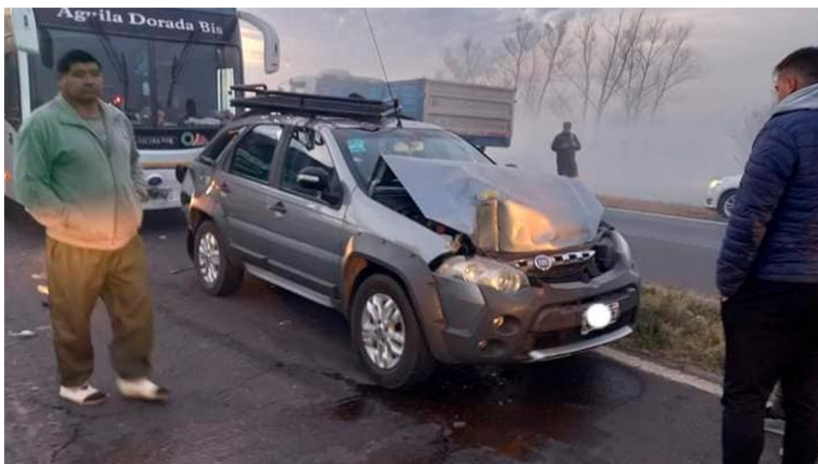
Figura 22. Posición final de los vehículos 5 y 7.