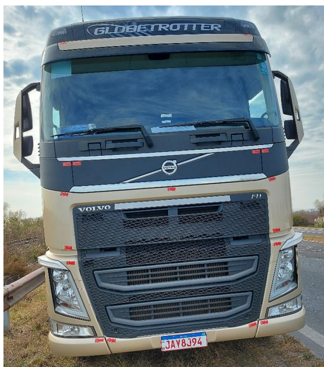
Figura 10. Fotografía del tractor del Vehículo 2.

El semirremolque del Vehículo 2 obtuvo principalmente daños en la parte posterior izquierda de la caja en toda su altura, la cual corresponde con la zona de la puerta trasera.