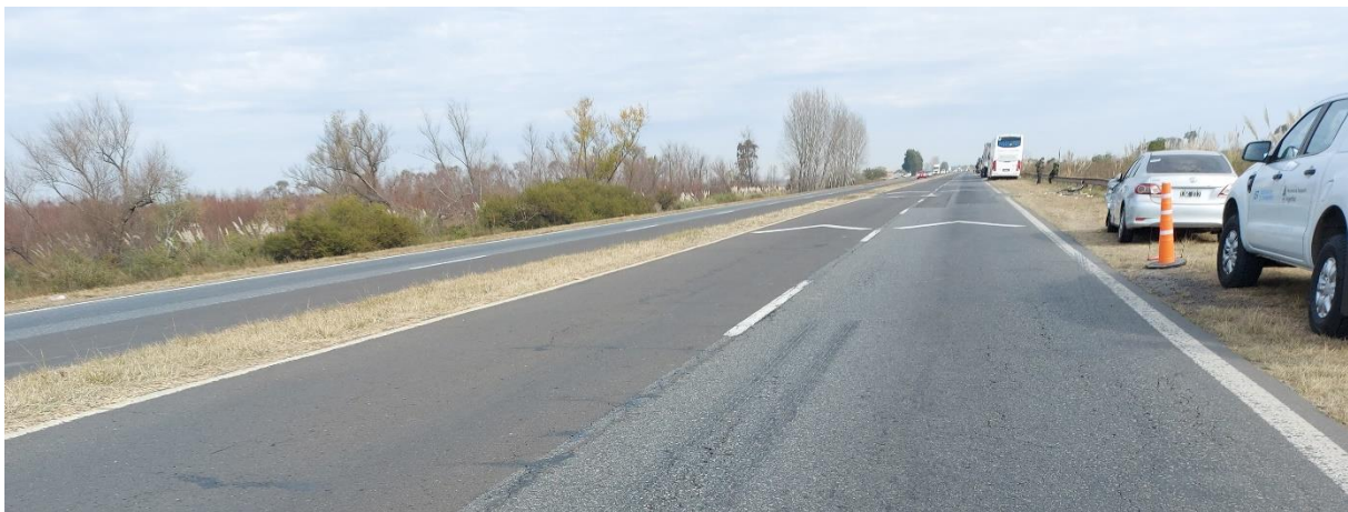
Figura 4. Señalización horizontal: demarcación de carriles y advertencias de distancia por baja visibilidad.

La señalización horizontal consta de línea blanca continua que demarca cada borde de calzada y línea blanca discontinua en los límites entre carriles. También, tanto en la señalización horizontal como en la vertical, cuenta con advertencia de conducción en condiciones adversas relacionadas con la visibilidad reducida.