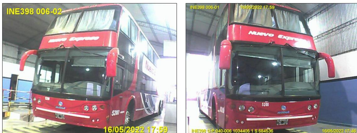
Figura 19. Fotovalidación del Vehículo 6 durante la Revisión Técnica Obligatoria.