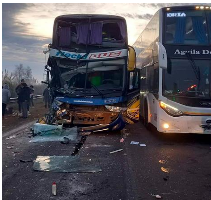
Figura 21. Posición final de los vehículos 4 y 5.