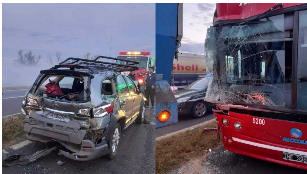
Figura 1. Imágenes de momentos posteriores al accidente con las posiciones finales de algunos de los vehículos involucrados.

se produjo una colisión múltiple entre once vehículos de los cuales tres eran camiones de carga, tres pertenecían al servicio de transporte de pasajeros, tres vehículos particulares, un patrullero de Gendarmería Nacional y un vehículo del cual se desconocen sus características, ya que, según se tuvo conocimiento, no permaneció en el lugar del suceso. Como resultado del suceso, se registraron daños materiales en la mayoría de los rodados involucrados. Asimismo, de las 99 personas que participaron en el suceso, siete resultaron ilesas y resta determinar el estado de las otras 92 personas en esta instancia de la investigación.