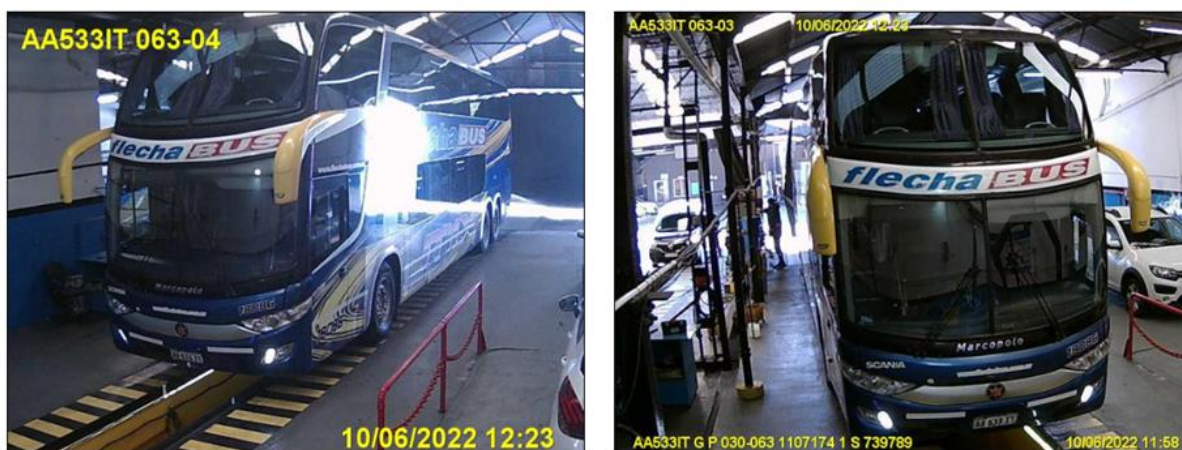
Figura 15. Fotovalidación del Vehículo 4 durante la Revisión Técnica Obligatoria.

El Vehículo 4 obtuvo daños en el sector anterior derecho y lateral derecho anterior. También en el sector frontal en toda su altura, incrementados sobre el lateral derecho, donde las deformaciones superan la línea del paragolpes. También se observaron faltantes de todos los parabrisas.