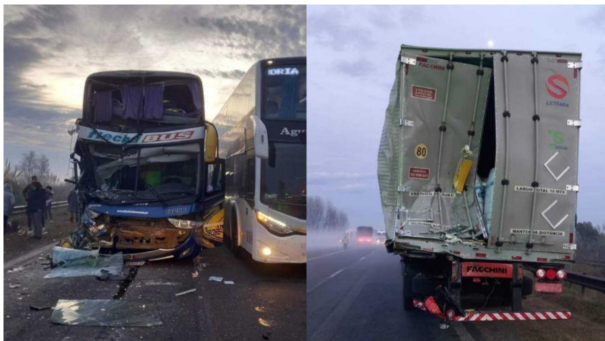
Figura 2. Imágenes de las posiciones finales de dos ómnibus y un vehículo de cargas.