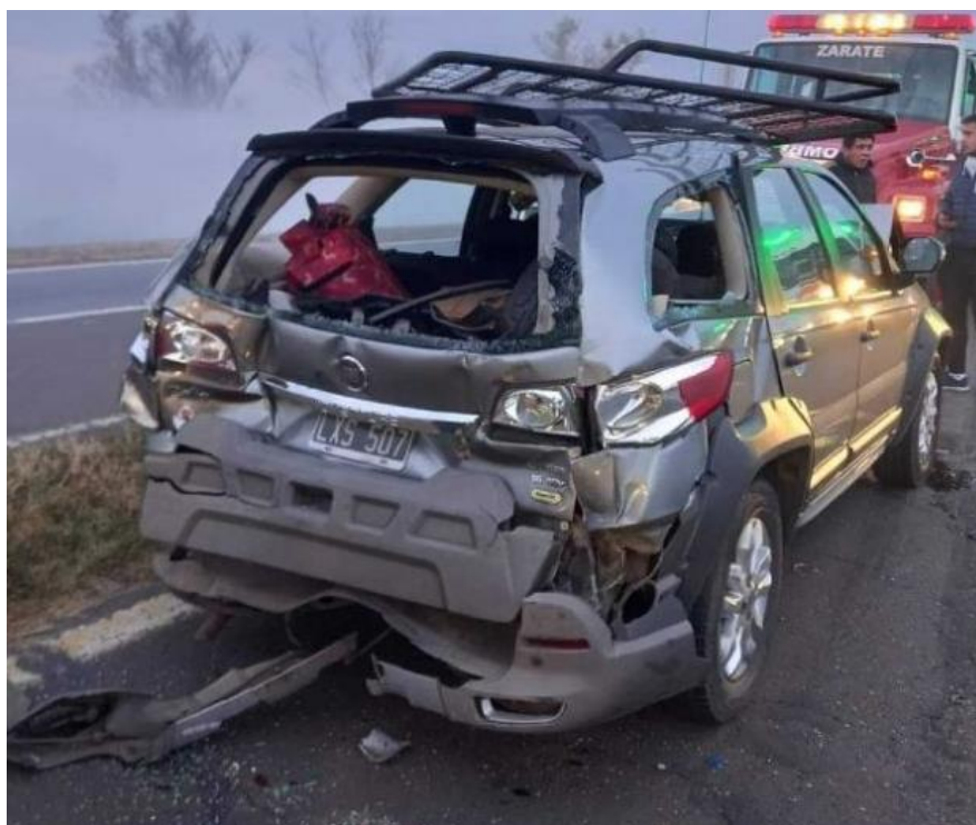
Figura 20. Fotografía de la parte trasera del Vehículo 7.