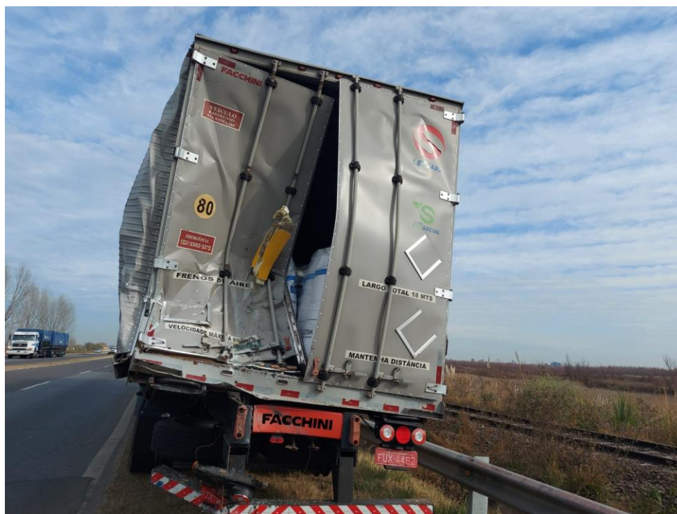
Figura 11. Fotografías del sector posterior del semirremolque del Vehículo 2.