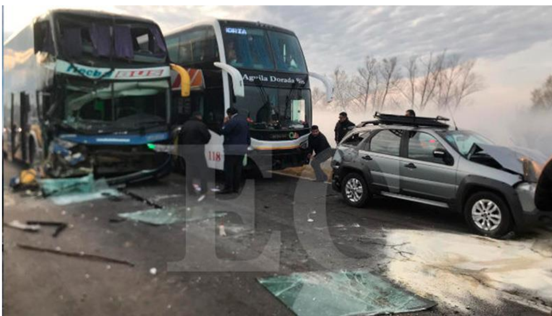
Figura 6. Posiciones de algunos de los vehículos involucrados momentos posteriores a la ocurrencia del suceso, en donde se puede percibir la neblina en el ambiente.

Al momento del suceso, las condiciones meteorológicas eran de cielo parcialmente nublado con neblina, con calzada seca y horario del amanecer, sin ángulo solar que propicie encandilamiento. Los vehículos se encontraban conduciendo con una visibilidad reducida producto de la neblina y de humo que había en la zona producto de quema en la zona.