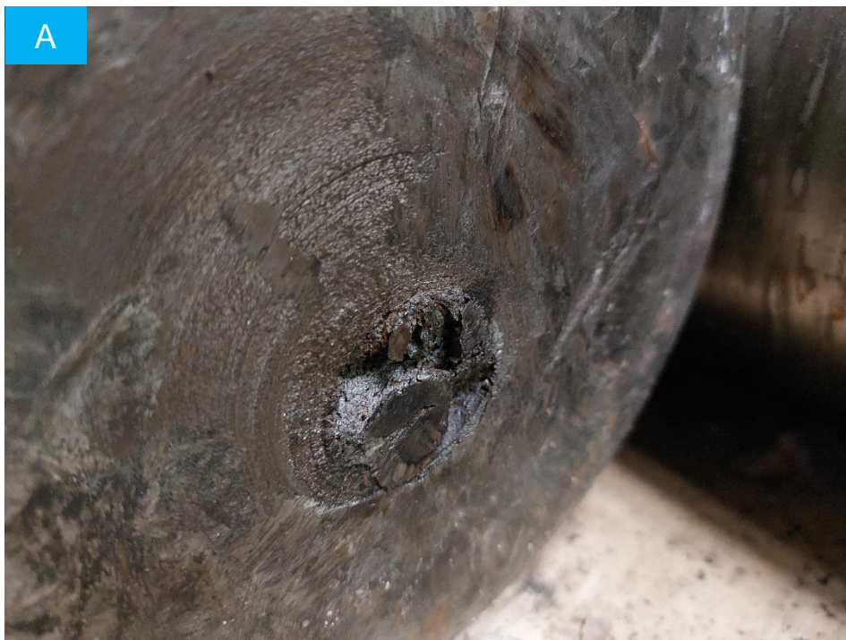
Figura 7. Cara A del eje fracturado.