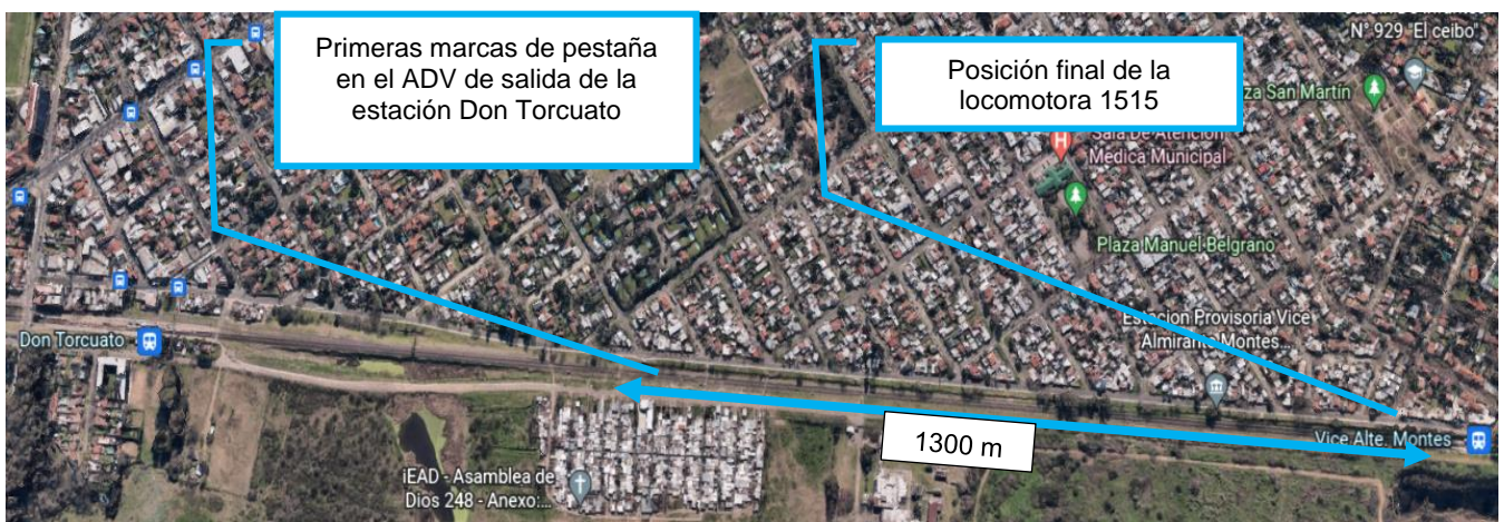
Figura 4. Croquis del descarrilamiento.

El tramo de vía por donde circuló el tren con un eje descarrilado se encontraba en una zona de desmonte y con escasa vegetación a ambos lados de la vía doble. El descarrilamiento inició en el ADV de salida de la estación Don Torcuato y finalizó en la punta de andén de la estación Vicealmirante Montes.