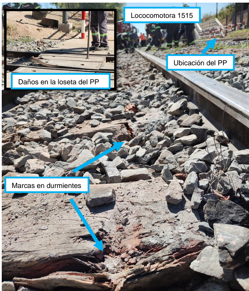
Figura 6. Daños materiales en durmientes y losetas.

También se encontraron daños en las losetas instaladas en el PP (puente peatonal), ubicado en el extremo del andén de la estación Vicealmirante Montes, donde quedó detenida la locomotora.