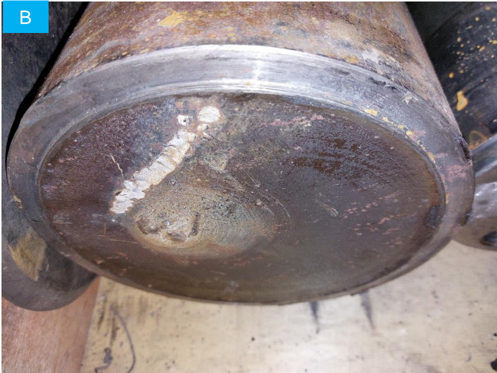
Figura 8. Cara B del eje fracturado.

La rotura del eje se produjo en el radio de acuerdo, que se encuentra entre la zona de calado de la rueda y la zona de calado de la corona, como puede observarse en las figuras anteriores.