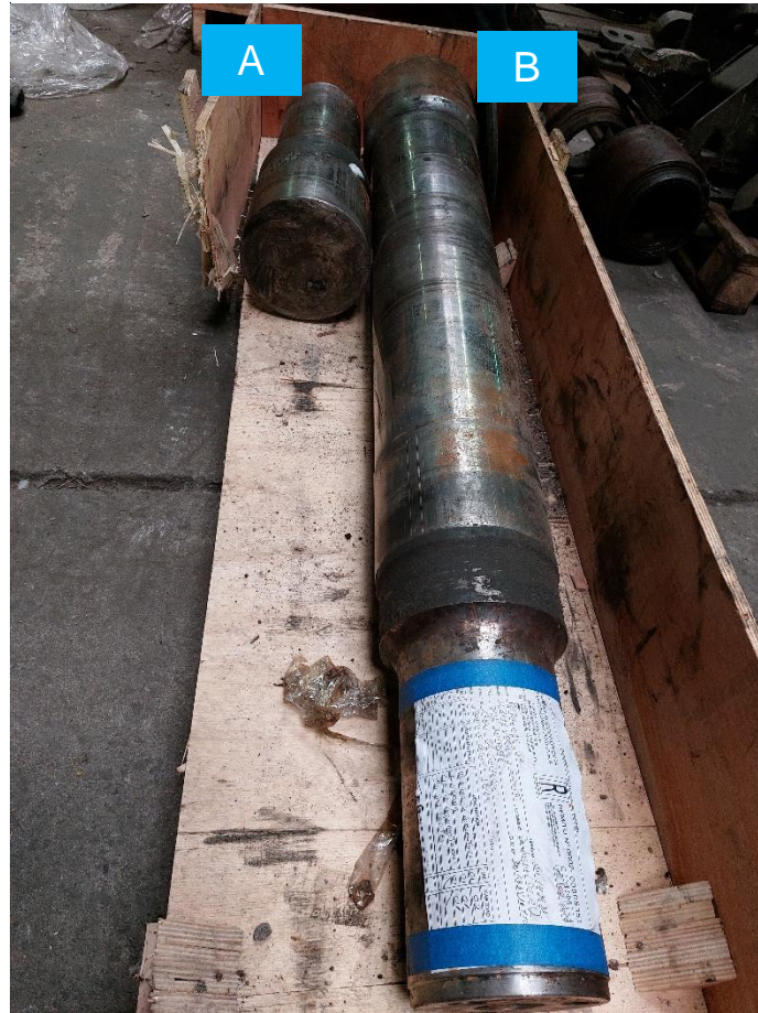
Figura 8. Eje fracturado de la locomotora 1515, caras A y B.