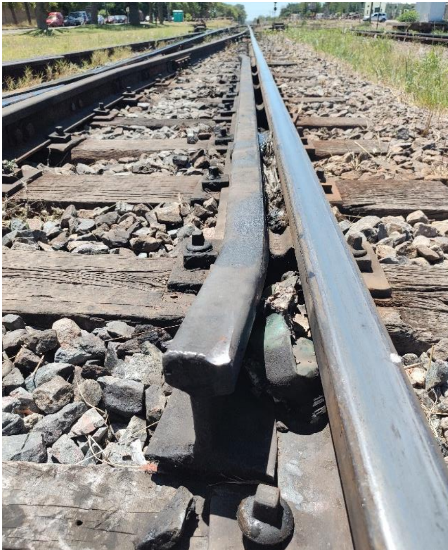
Figura 1. Sector donde se hallaron las primeras marcas del descarrilamiento en la vía descendente, en cercanías del cambio de salida de la estación Don Torcuato.

El 13 de enero de 2022, el tren de pasajeros 3014, conformado por la locomotora 1515 y 6 coches, partió de la estación Grand Bourg, en la provincia de Buenos Aires, con destino a la estación Retiro, CABA. A las 05:26 aproximadamente, durante su salida de la estación Don Torcuato, la locomotora sufrió la fractura del eje delantero de su segundo bogie en sentido de la marcha del tren, y continuó circulando aproximadamente 1300 m con el eje de la locomotora fracturado y descarrilado hasta la estación Vicealmirante Montes, donde se detuvo con los dos ejes del segundo bogie descarrilados.