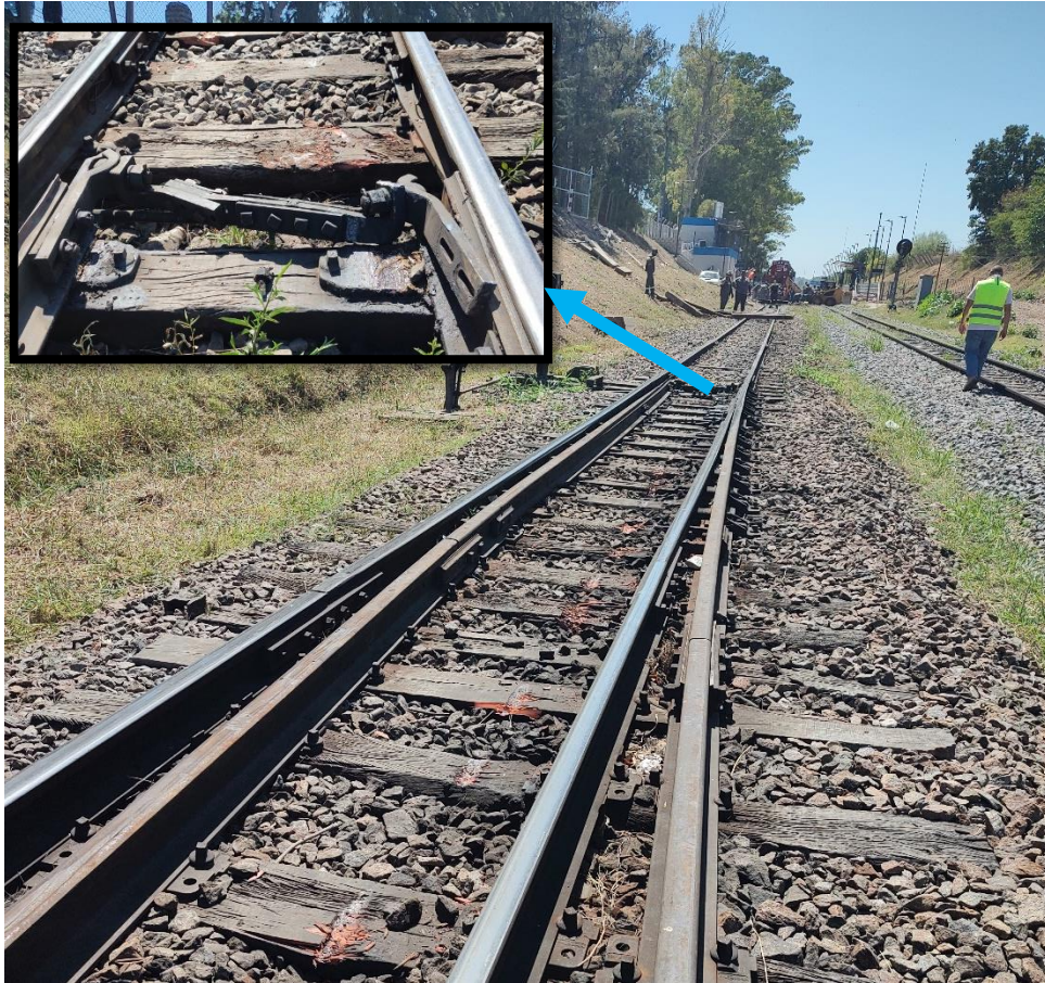
Figura 7. Posición de la barra de ADV doblada.

Asimismo, se encontró una torcedura en una de las barras del ADV ubicado a 80 m aproximadamente de la posición final de la locomotora afectada, como se observa en la figura 7.