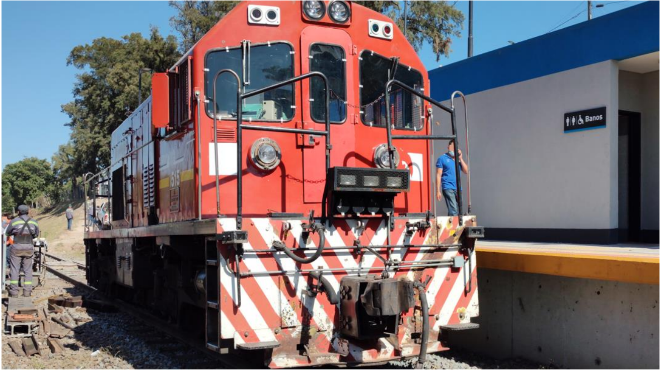
Figura 5. Posición final de la locomotora descarrilada en el andén descendente de la estación Vicealmirante Montes.

En cuanto a la posición final del tren, luego de circular 1300 m por la vía descendente, la locomotora se detuvo con ambos ejes de su segundo bogie en sentido de la marcha descarrilados, a la altura del andén de la estación Vicealmirante Montes.