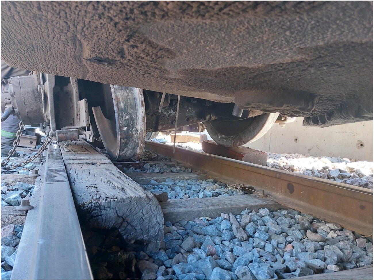
Figura 2. Eje fracturado de la locomotora 1515.