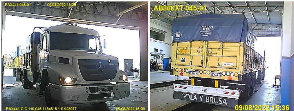
Figura 6. Fotovalidación del camión rígido y del acoplado durante su última RTO.