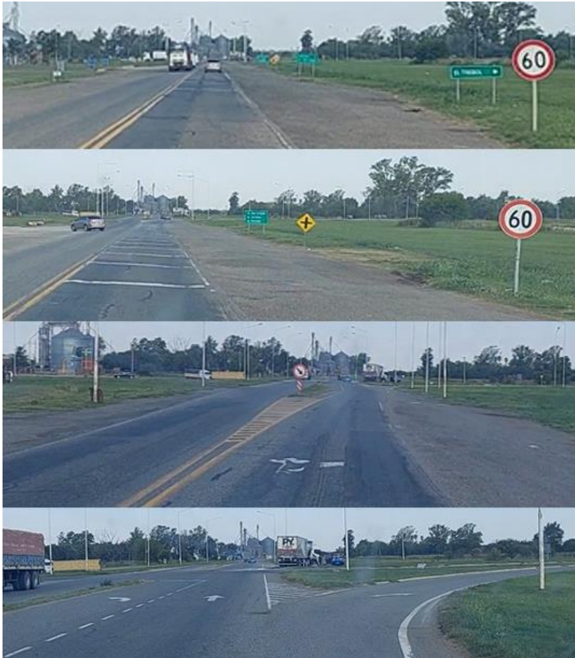
Figura 4. Secuencia de imágenes de la Ruta Nacional 34 en avance con sentido hacia la intersección con Ruta Provincial 65.

200 m antes de la zona de colisión, la calzada comienza a ensancharse progresivamente y presenta una división central entre sus sentidos de circulación, primero a través de demarcación horizontal y luego, previo a la intersección, por medio de una isleta que conforma una dársena de giro a la izquierda. El ancho total de calzada a la altura del cruce resulta de 15 m.