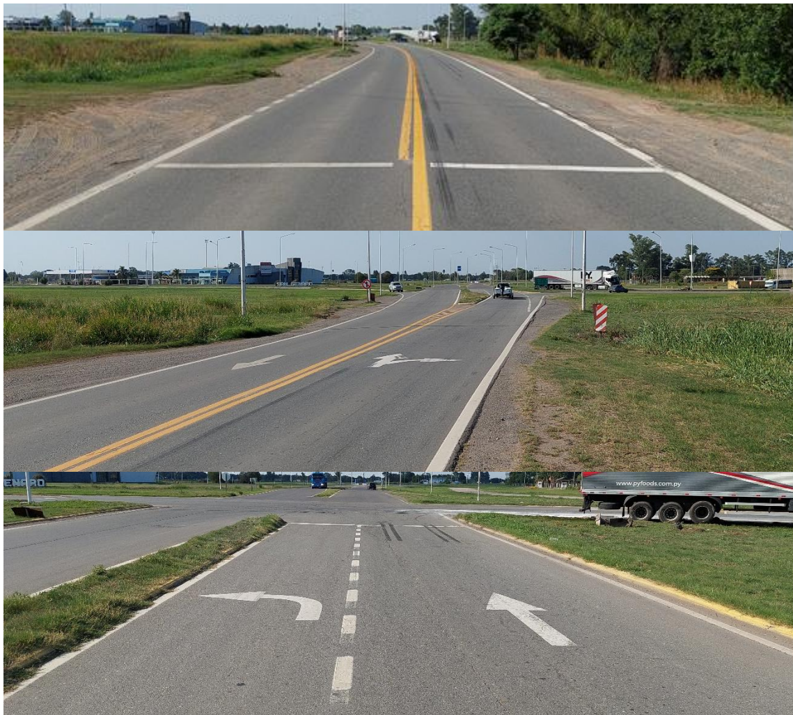
Figura 3. Secuencia de imágenes de la Ruta Provincial 65 en avance con sentido hacia la intersección con Ruta Nacional 34.

Por su parte, la Ruta Nacional 34 es una vía de circulación que se desarrolla en sentido oeste-este, desde la localidad de Centeno hacia la de Clason, y viceversa. Considerando el sentido de avance del Vehículo 2, con sentido hacia la ciudad de Clason, antes de la intersección donde ocurrió el suceso la ruta se presenta como una vía con calzada única, de 6,6 m de ancho, con dos carriles de circulación, uno por sentido de marcha. La superficie de circulación es de pavimento de asfalto, con banquetas de 3 m de ancho, también de asfalto. Las líneas de borde de calzada, apenas visibles, eran continuas y blancas, mientras que la separación de carriles estaba marcada con una doble línea amarilla. Al aproximarse al cruce con la Ruta Provincial 65, se observaron algunos agrietamientos y deformación longitudinal. Unos