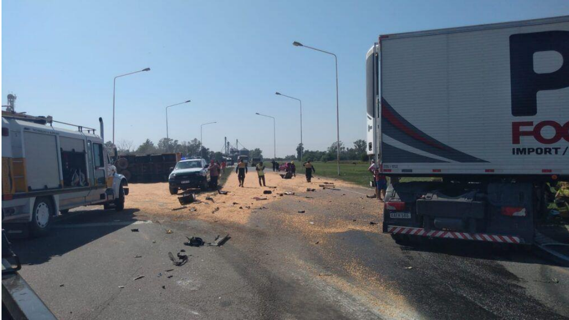
Figura 1. Posición final de las unidades involucradas.

la calzada, donde perdió su carga. El conductor del Vehículo 1 resultó con lesiones, mientras que el conductor del Vehículo 2 resultó ileso.