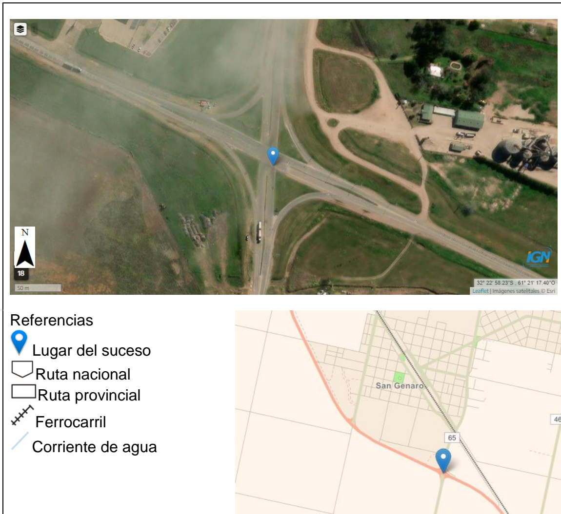
Figura 2. Mapa de localización del suceso.