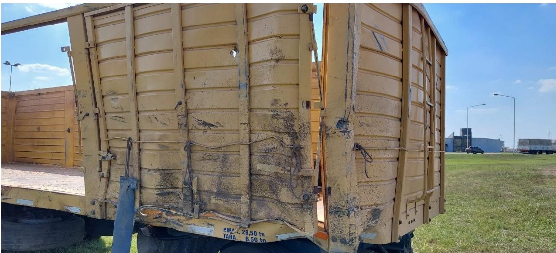
Figura 10. Impacto recibido en el acoplado del Vehículo 2.

En una entrevista realizada en el lugar del suceso, el conductor del Vehículo 2 manifestó haber visto la trayectoria del Vehículo 1 y haber realizado una maniobra de esquite hacia su izquierda.