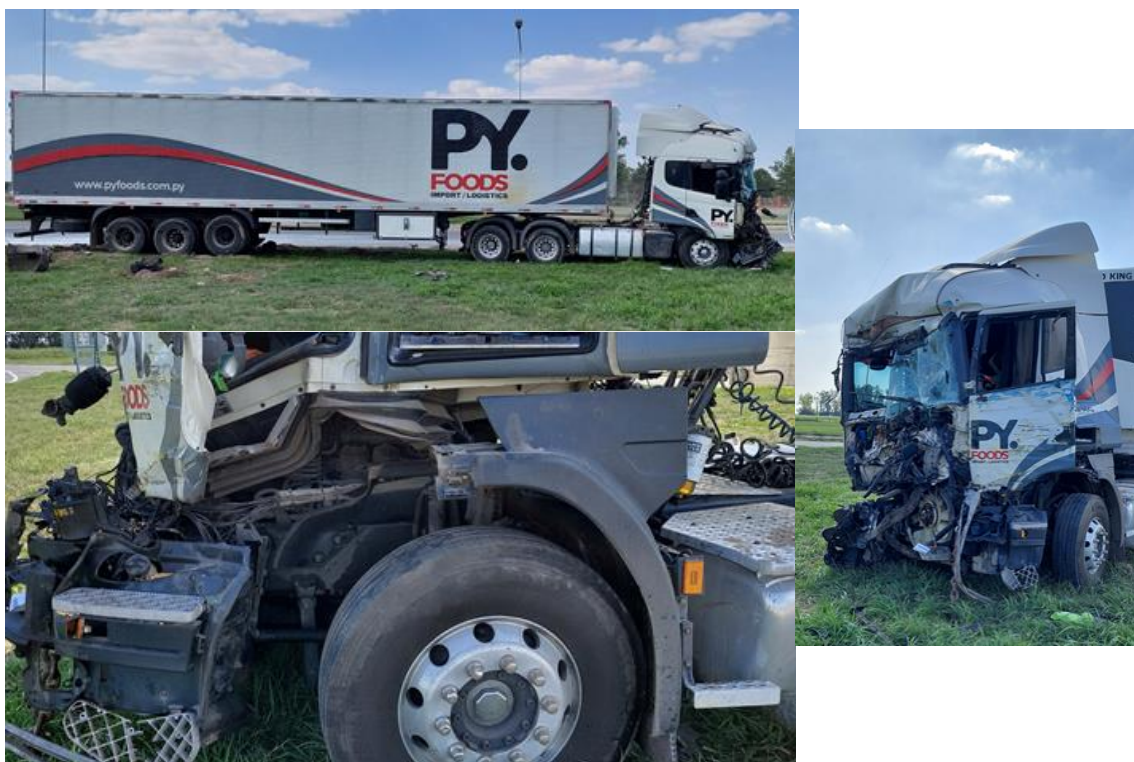
Figura 5. Daños constatados en el Vehículo 1.

El camión tractor del Vehículo 1 poseía daños por impacto en el sector anterior, en el centro, con leve inclinación a la derecha. Este impacto afectó el parabrisas, el sector anterior del techo, parrilla, radiador y soportes del motor, así como la escalera de ascenso al puesto de conducción y parte de la puerta. Sobre este último sector, se observaron marcas y señales propias de maniobras de rescate. El semirremolque no poseía daños visibles.