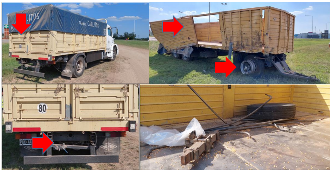
Figura 7. Daños en el camión (izquierda) y en el acoplado (derecha) del Vehículo 2.

El camión rígido del Vehículo 1 poseía daños en la zona posterior que afectó al gancho del sistema de enganche. Por su parte, el acoplado poseía un impacto en el lateral