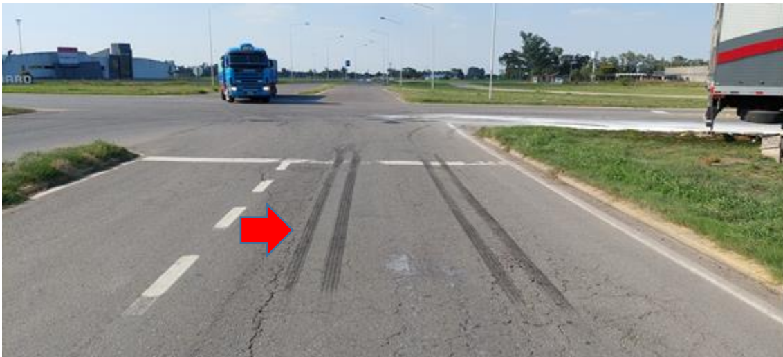
Figura 8. Huellas de frenada de neumáticos duales sobre Ruta Provincial 65.

En la zona inmediata anterior a la colisión, sobre la Ruta Provincial 65, se observaron marcas de frenada de neumáticos duales, que se extienden unos 10 m.