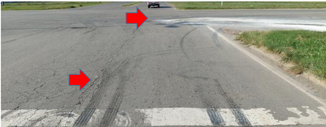
Figura 9. Zona de colisión.

En una entrevista realizada en el lugar del suceso, el conductor del Vehículo 2 manifestó haber visto la trayectoria del Vehículo 1 y haber realizado una maniobra de esquite hacia su izquierda.