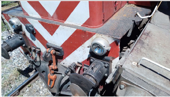
Fig. 1. Vista del impacto en la zona del miriñaque de la locomotora 6418