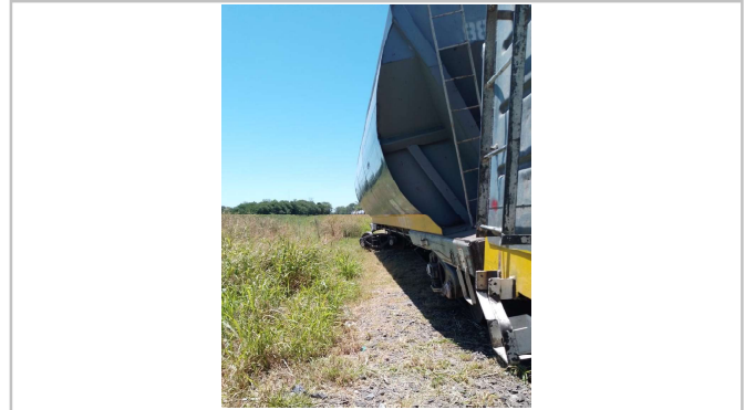
Fig. 2. Vista de los vagones descarrilados por el choque