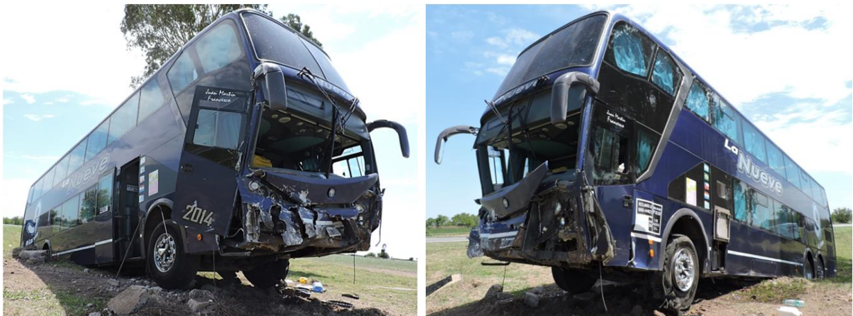
Figura 6. Visualización de los daños del vehículo.

Presentó daños en la parte frontal inferior, rotura del paragolpes delantero y de los parabrisas inferiores. También se observaron deformaciones en la parte lateral inferior izquierda y la puerta del conductor. El vehículo tuvo desprendimiento parcial de la puerta delantera derecha de la cabina de conducción y total de paragolpes trasero.