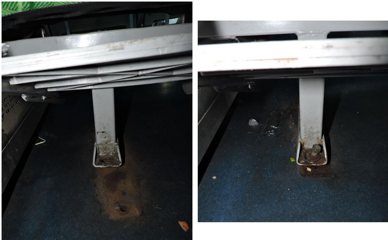
Figura 8. Detalle del anclaje de las butacas 25/26 (izquierda) y 37/38 (derecha).

Al momento del registro del vehículo, los cinturones de los últimos asientos dobles del piso inferior (sin numerar) se encontraban trabados por debajo de las butacas, lo que podría haber dificultado su utilización.