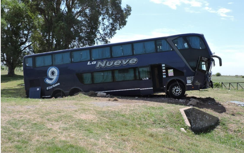
Figura 1. Vehículo 1 en su punto de inmovilidad final.

contiguos a este y finalmente impactó con una alcantarilla situada en el costado de la calzada. Producto del suceso, al menos cuatro personas resultaron con lesiones.