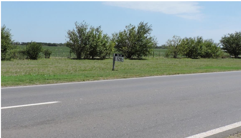
Figura 4. Indicador kilométrico, junto al carril con sentido de Cañada Rosquín hacia Casas.