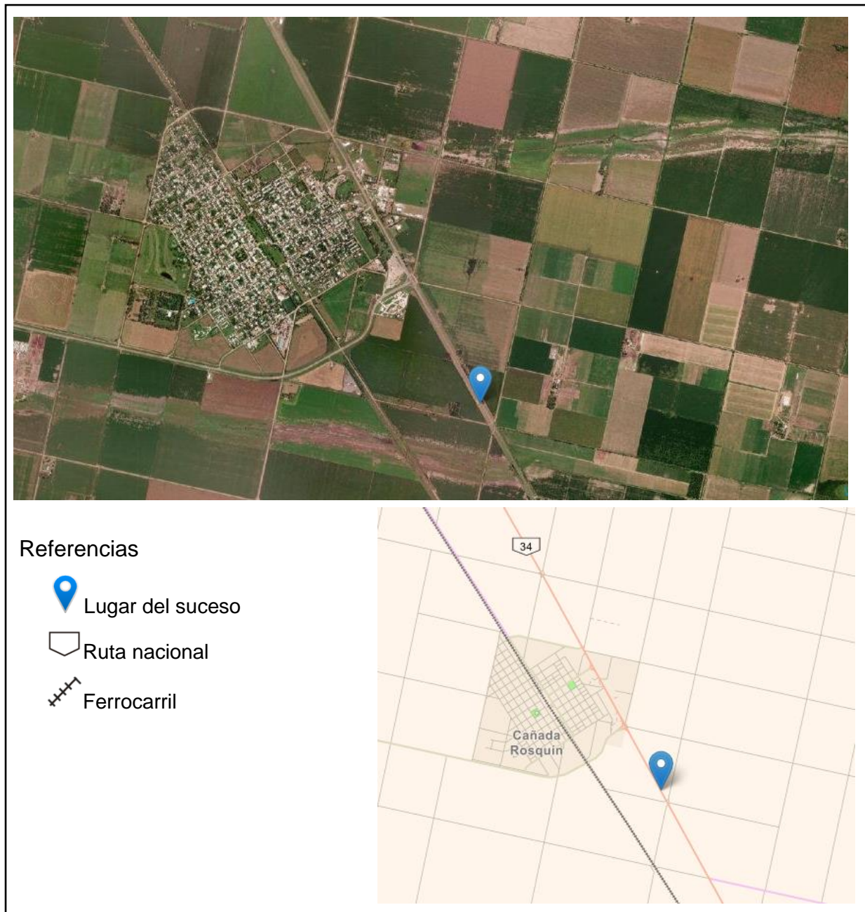
Figura 2. Mapa de localización del suceso.