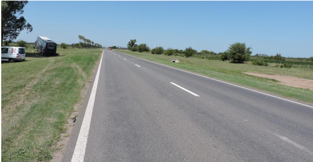
Figura 3. Lugar del suceso, vista desde Cañada Rosquín hacia Casas.