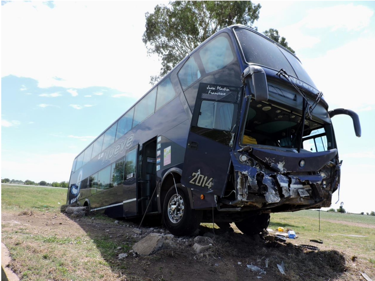
Figura 9. Vehículo en su posición final.