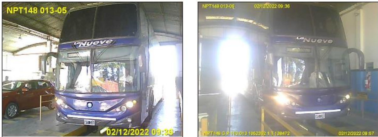
Figura 5. Fotovalidación de la última RTO del ómnibus doble piso dominio NPT148.