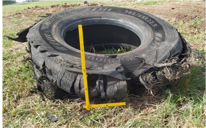
Figura 7. Detalle del neumático delantero izquierdo, luego de haber sido retirado de la unidad.

El código DOT (Department Of Transportation) no se halló en esta primera revisión. Según entrevistas en campo, el neumático delantero izquierdo y el delantero derecho habrían sido adquiridos juntos en la misma ocasión y serían de igual marca. La fecha de fabricación observada en el neumático delantero derecho fue en la semana 43 del año 2017.