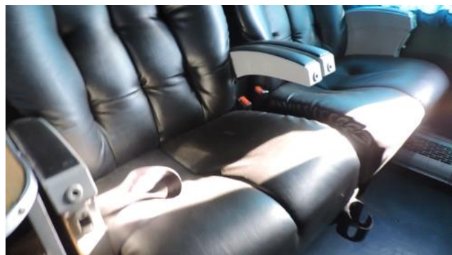
Figura 9. Captura de video relevamiento. Cinturones con dificultad de utilización.

Al momento del registro del vehículo, los cinturones de los últimos asientos dobles del piso inferior (sin numerar) se encontraban trabados por debajo de las butacas, lo que podría haber dificultado su utilización.